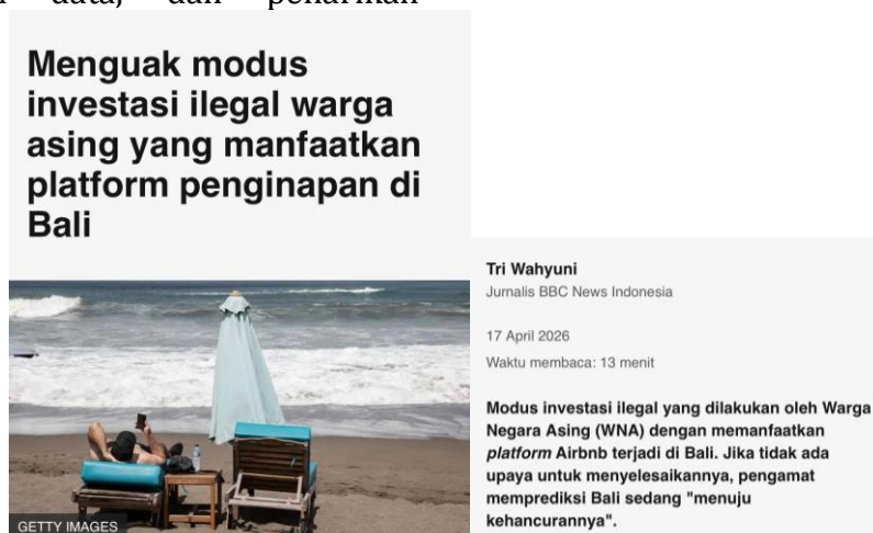
Gambar 1. Cuplikan Berita Mengenai Penerbitan Investasi Ilegal WNA di Bali (2026)

Berdasarkan temuan penelitian menunjukkan bahwa praktik investasi ilegal oleh Warga Negara Asing (WNA) di Bali merupakan sebuah operasi yang terencana dengan memanfaatkan celah pada ekosistem digital.