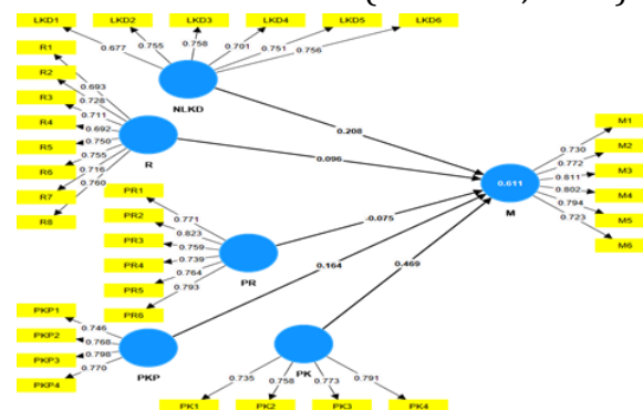
Gambar 1 : ouput smartPLS4 diolah penulis, 2025

Agar model penelitian dapat menunjukkan lebih dari 50% varians indikator, kriteria untuk uji penambahan indikator pada masing-masing item pertanyaan harus lebih besar dari 0,708 (Hair et al. , 2019)