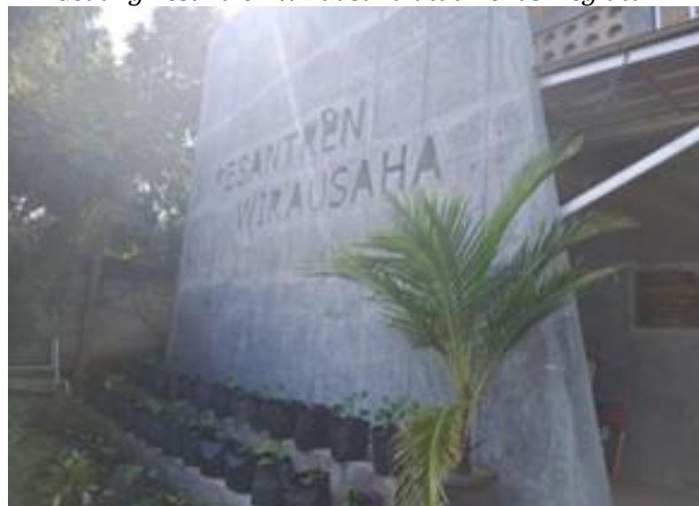
Gedung Pesantren Wirausaha atau Lokasi kegiatan