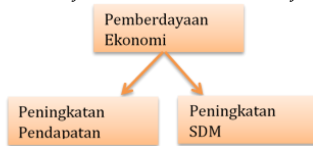
Gambar 5. Hasil Pemberdayaan Ekonomi di Pasar Yosomulyo Pelangi

Terdapat dua indikator keberhasilan terhadap pemberdayaan ekonomi yang diimplikasikan kepada masyarakat di Yosomulyo atau bagian dari anggota Payungi, yaitu: