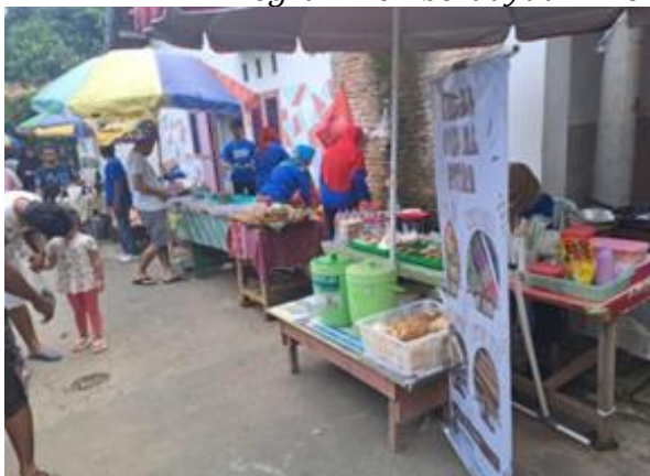
Gambar 4. Program Pemberdayaan Ekonomi pada Pasar Ahad Payungi

lokal, memungkinkan penghasilan langsung dan mengurangi ketergantungan pada pasar eksternal.