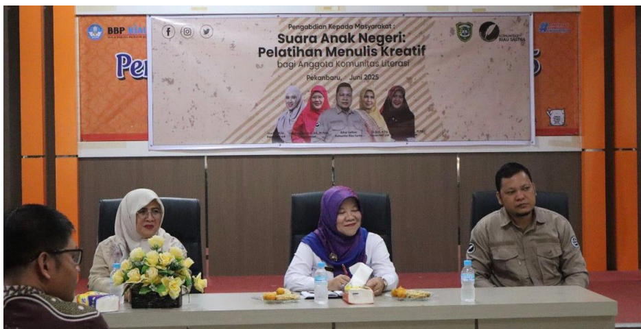
Gambar 1. Tim Pengemas PBSI FKIP UIR Beserta Mitra

Dengan penggunaan kombinasi instrumen kuesioner, observasi, dan rubrik penilaian karya, metode evaluasi dalam kegiatan pengabdian ini diharapkan mampu memberikan gambaran yang lebih komprehensif mengenai efektivitas pelatihan menulis kreatif, baik dari sisi peningkatan kompetensi menulis maupun penguatan aspek afektif dan keberlanjutan praktik literasi peserta.