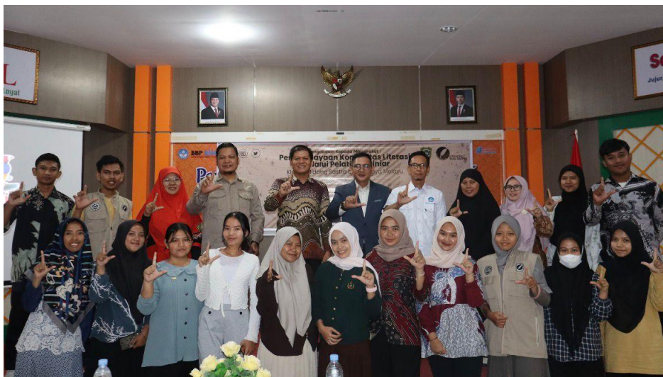
Gambar 5. Foto Bersama di Akhir Acara

Berdasarkan evaluasi akhir, peserta juga menyampaikan rekomendasi agar kegiatan pelatihan dilaksanakan secara berkala dengan durasi yang lebih panjang. Hal ini menunjukkan bahwa peserta merasa pelatihan yang diberikan belum sepenuhnya mampu mengakomodasi seluruh kebutuhan mereka dalam mengembangkan keterampilan menulis kreatif. Usulan tersebut mengindikasikan tingginya minat dan komitmen peserta untuk terus belajar serta menunjukkan bahwa pelatihan ini telah memberikan pengalaman yang bermakna. Rekomendasi tersebut dapat menjadi dasar bagi perencanaan program pengabdian masyarakat selanjutnya agar dampak pembelajaran dapat lebih optimal dan berkelanjutan.