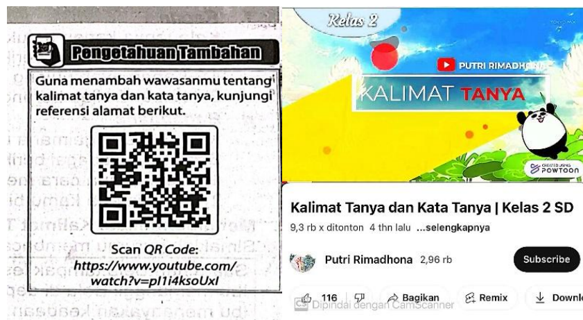
Gambar 4 & 5. QR Code & Isi QR Code Bab 2

hasil cetak atau patokan kualitas tampilan elektronik yang ramah pengguna, aman, dan nyaman. Grafika dalam buku ini mengacu pada elemen visual lainnya untuk memperkaya dan memperjelas isi buku. Grafika ini berfungsi untuk menyampaikan informasi, memperjelas konsep, menambah daya tarik, dan meningkatkan pengalaman membaca. Komponen penilaian aspek grafika untuk buku cetak ini meliputi kualitas cetak, kualitas penjilidan, dan kualitas sisir/potong bersih. Komponen penilaian aspek tampilan elektronik untuk buku elektronik meliputi keterbacaan pada berbagai perangkat dan platform, ketersediaan dalam ukuran berkas (file) yang relatif ringan, dan kemudahan didistribusikan kepada pengguna. Maka dalam buku tema Cemerlang ini dapat dilihat standar grafika meliputi aspek tampilan elektronik yang disediakan oleh buku tema ini seperti data 10 di bawah ini.