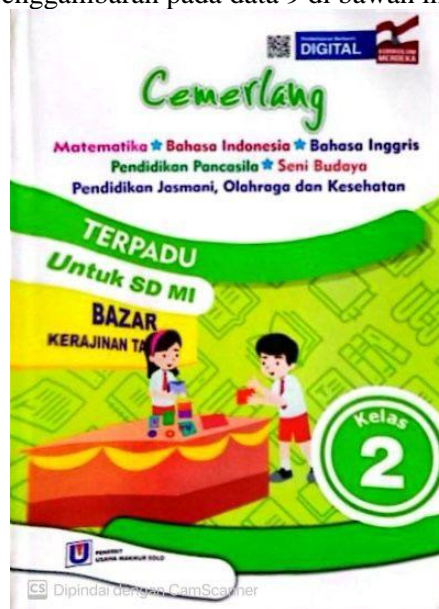
Gambar 3. Sampul Buku Tema Cemerlang

Desain merupakan proses perencanaan proses perencanaan yang sistematis yang dilakukan sebelum tindakan pengembangan atau pelaksanaan sebuah kegiatan, (Pribadi, 2009). Dalam hal ini desain yang dimaksud berdasarkan Peraturan Menteri Pendidikan, Kebudayaan, Riset, dan Teknologi Nomor 039 Tahun 2022 Tentang Penilaian Buku Pendidikan, (Aditomo, 2022), adalah standar perancangan halaman isi buku dan sampul buku yang memenuhi aspek desain komunikasi visual. Komponen penilaian ini meliputi penggunaan ilustrasi, desain halaman isi, dan desain sampul buku. Ketiga komponen aspek desain ini disesuaikan dengan kepatutan, estetika, dan tingkat perkembangan usia siswa. Maka dalam buku tema Cemerlang ini dapat dilihat standar desain pada sampul yang menggunakan ilustrasi seperti penggambaran pada data 9 di bawah ini.