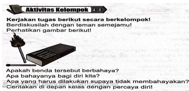
Gambar 2. Tugas Kelompok pada Bab 3 Bahasa Indonesia

Standar penyajian yang ditetapkan oleh Peraturan Menteri Pendidikan, Kebudayaan, Riset, dan Teknologi Nomor 039 Tahun 2022 Tentang Penilaian Buku Pendidikan adalah standar pemaparan isi buku yang mudah dipahami, menarik, dan komunikatif, (Aditomo, 2022; Febriyanti & Mulyawati, 2023). Maka dalam hal ini poin penilaian aspek penyajian mencakup kelayakan penyampaian isi buku sesuai dengan tingkat perkembangan usia peserta didik dan/atau pembaca sasaran dan kelayakan penggunaan bahasa yang tepat dan komunikatif sesuai dengan tingkat penguasaan bahasa peserta didik dan/atau pembaca sasaran. Pada buku tema Cemerlang terbitan Usaha Makmur Solo dapat dilihat pada data 8 di bawah ini.