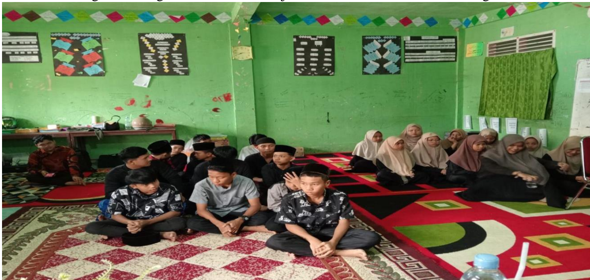
Gambar 4. Peserta sedang Menyimak Bacaan dan Irama Nalam