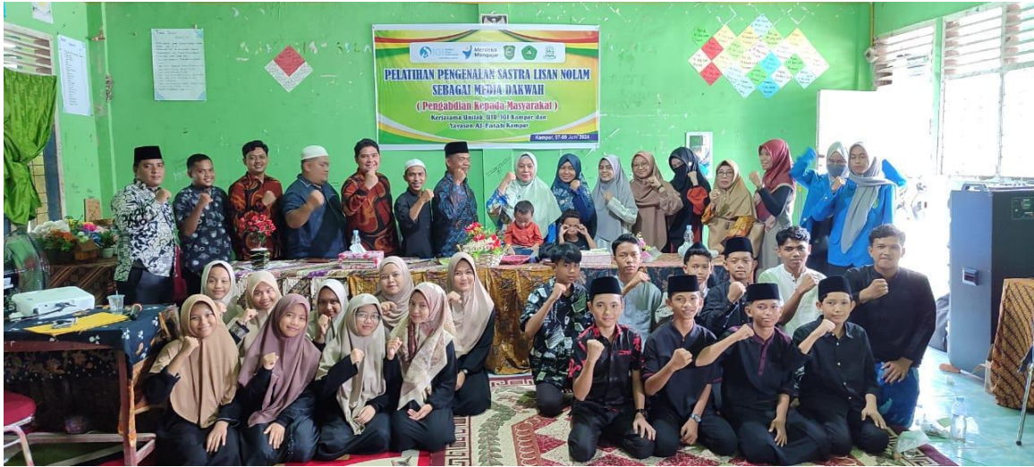
Gambar 1. Peserta Pelatihan Pengenalan Sastra Lisa Menolam sebagai Media Dakwah