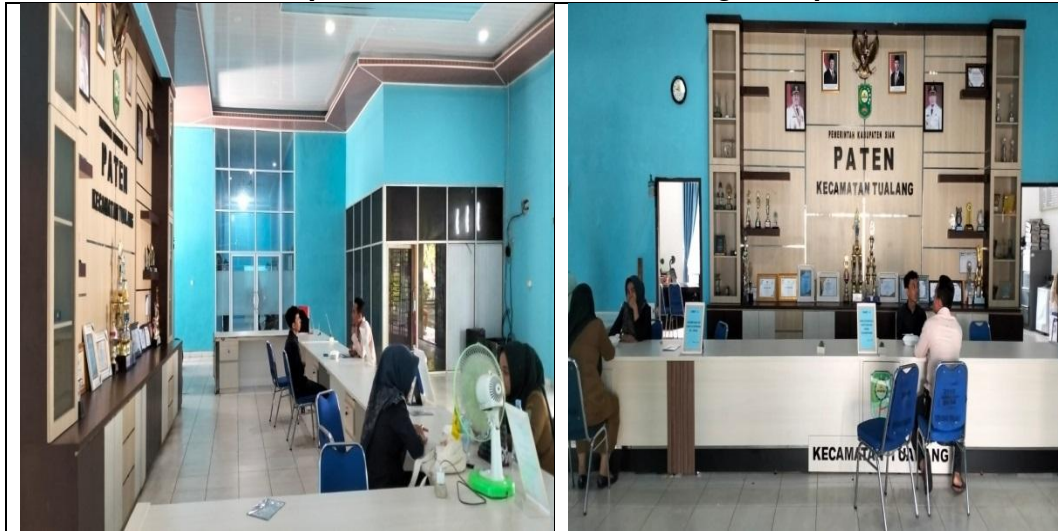
Gambar.2 Suasana Pelayanan di Kantor Camat Tualang Kabupaten Siak

Berdasarkan dokumentasi yang diperoleh di lapangan, dapat disimpulkan bahwa pola komunikasi yang diterapkan oleh pegawai pelayanan di Kantor Camat Tualang Kabupaten Siak umumnya bersifat satu pegawai melayani satu masyarakat. Hal ini menunjukkan bahwa pelaksanaan komunikasi sudah tergolong cukup baik, namun dari sisi durasi pelayanannya menjadi cukup lama karena jumlah pegawai yang tersedia masih terbatas.