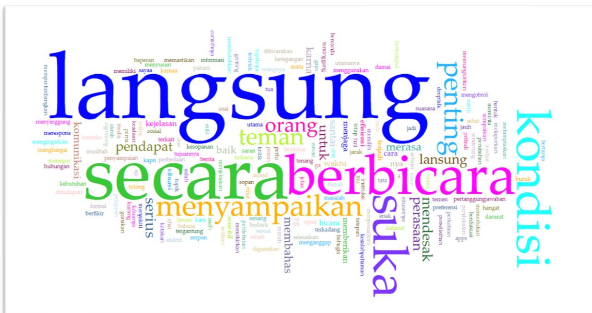
Gambar 2. Visualisasi Jawaban Siswa Mengenai Preferensi Bertutur Secara Langsung Atau Tidak Langsung Menggunakan Aplikasi Voyant-Tools

Respon yang diberikan oleh informan berkenaan dengan pertanyaan mengenai preferensi bertutur secara langsung atau tidak langsung disajikan dalam bagan berikut.