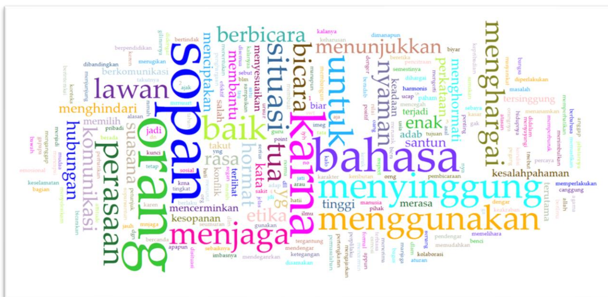
Gambar 1. Visualisasi Jawaban Siswa Mengenai Alasan Memilih Menggunakan Bahasa Yang Santun Dalam Situasi Tertentu Menggunakan Aplikasi Voyant-Tools