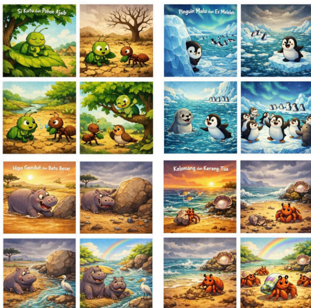
Gambar 7. Ilustrasi cerita