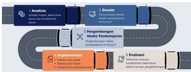
Gambar 1. Prosedur penelitian

Penelitian ini bertujuan untuk mengembangkan media pembelajaran dengan menggunakan model ADDIE yang memiliki prosedur dengan tahapan sebagai berikut: