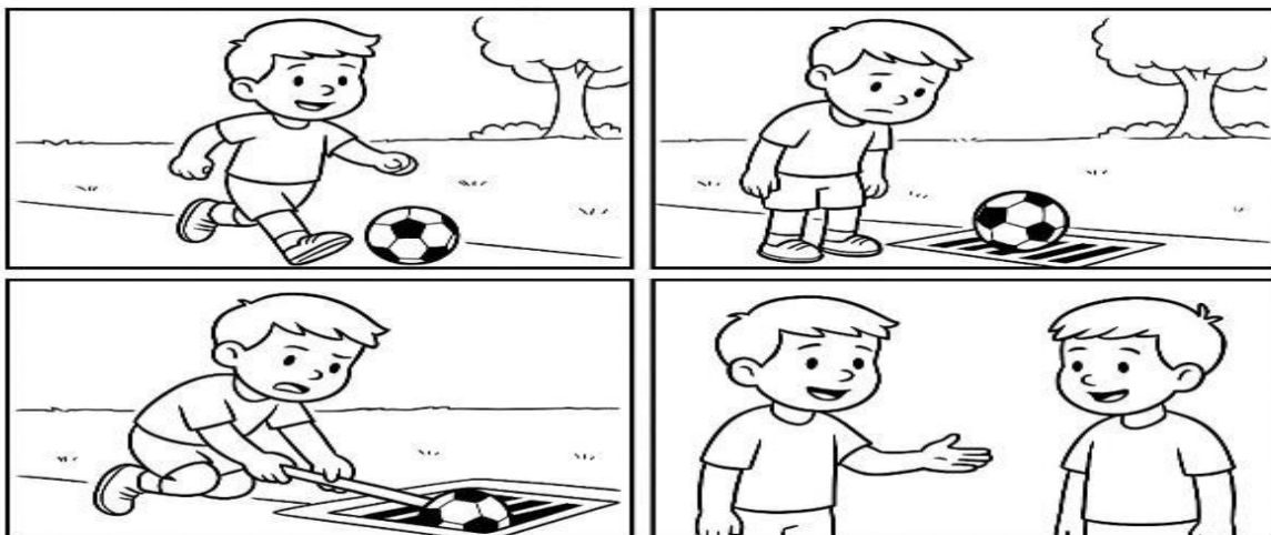
Gambar 1.