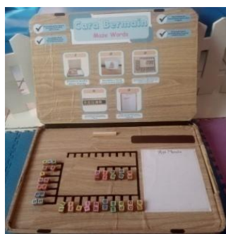
Gambar 2 Produk Media Maze Words

disesuaikan dengan kebutuhan anak. Dari masalah yang muncul, peneliti mengembangkan media maze words sebagai media pembelajaran yang dapat membantu meningkatkan minat literasi baca dan tulis anak. Perancangan desain media maze words ini dibuat menggunakan aplikasi canva sebagai bentuk gambaran medianya.