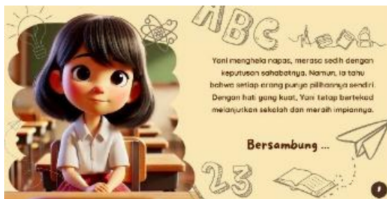
Gambar 10. Halaman 10