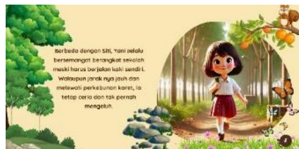
Gambar 6. Halaman 6