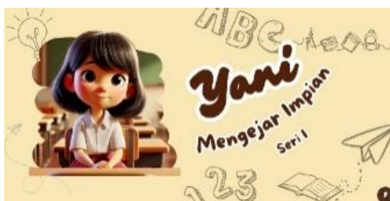
Gambar 11. Halaman 11