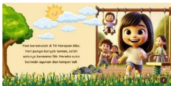
Gambar 3. Halaman 3