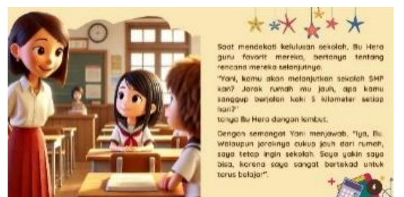
Gambar 7. Halaman 7