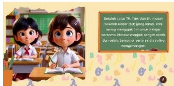
Gambar 4. Halaman 4

Setelah melihat analisis kebutuhan yang ada di lapangan bahwa motivasi belajar pada anak belum meningkat, dikarenakan oleh media yang terbatas, sehingga peneliti membuat desain buku bergambar yang menarik dengan nuansa kearifan lokal budaya perdesaan dulu. Berikut desain buku cerita bergambar seri I: