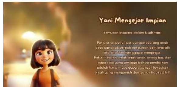
Gambar 12. Halaman 12