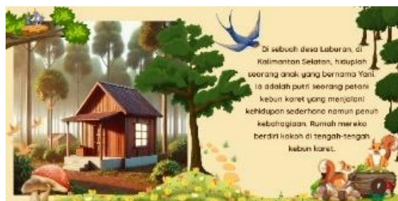
Gambar 2. Halaman 2