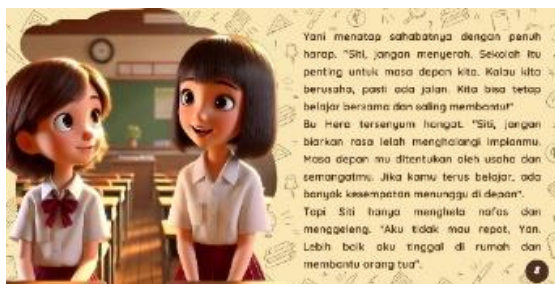
Gambar 9. Halaman 9