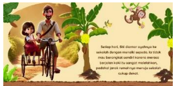
Gambar 5. Halaman 5