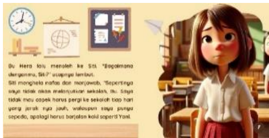
Gambar 8. Halaman 8