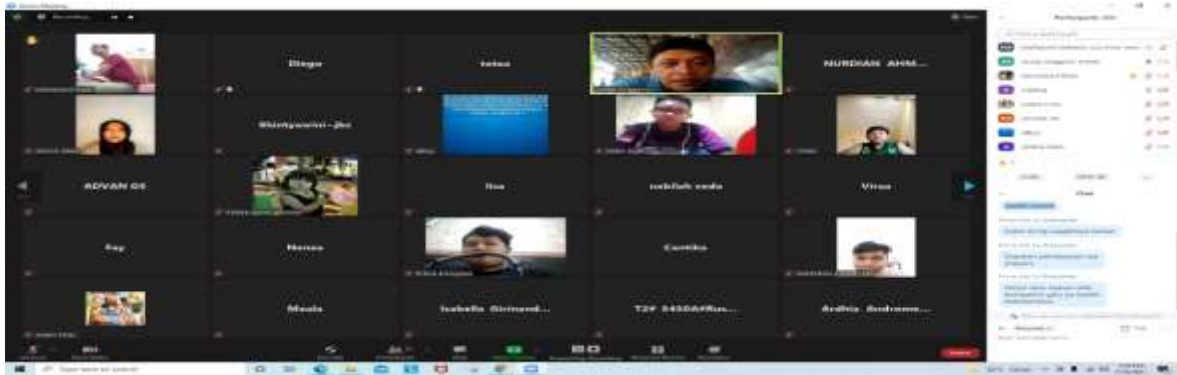
Gambar 1 Kegiatan Pelaksanaan Pelatihan