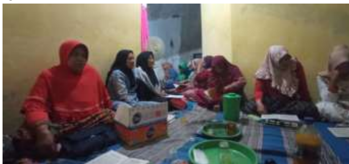
Gambar 1. Warga Tidak Menggunakan Masker dalam Acara Pengajian Rutin

(Gambar 1). Maka dari itu Kami bersama tim bertujuan membantu masyarakat Desa Rejoslamet untuk dapat menerapkan perilaku hidup sehat di era pandemi dengan cara lebih patuh pada protokol kesehatan. Tim pengabdian mengadakan program penguatan patuh protokol kesehatan dengan bahasa yang mudah dipahami, serta pelatihan pembuatan strap masker dengan bahan yang mudah didapat, ekonomis, ramah lingkungan dan mudah pembuatannya sebagai upaya pencegahan penularan covid-19 varian omicron.