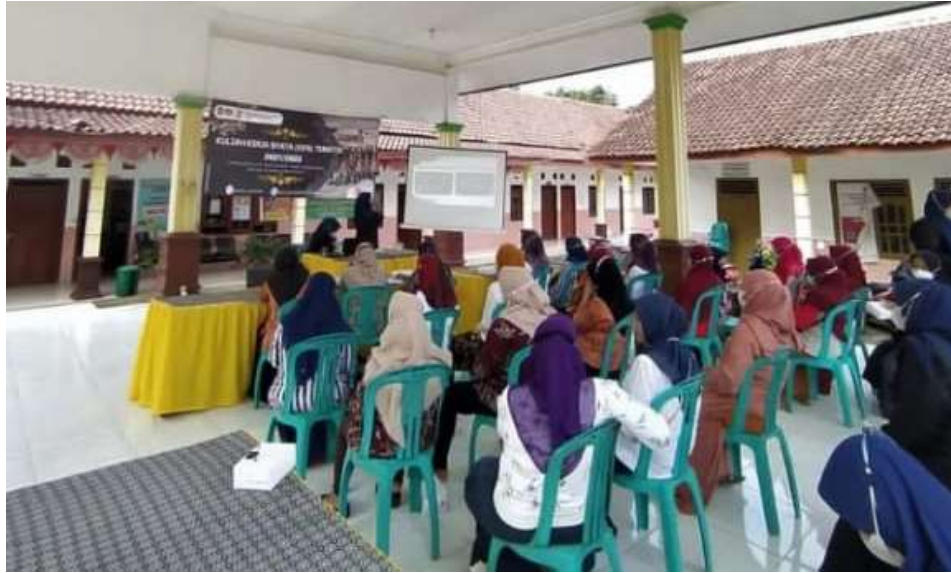
Gambar 3. Pengutan Pentingnya Menerapkan Protocol Kesehatan