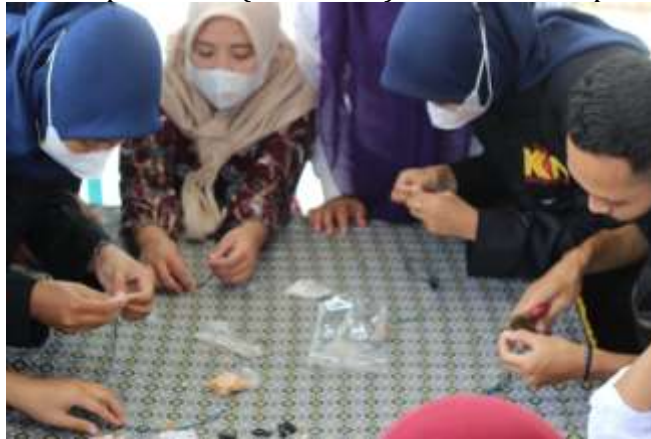
Gambar 4. Praktek Pembuatan Strap Masker

Pelatihan berupa praktek pembuatan strap masker. Berikut adalah foto kegiatan dalam pembuatan strap masker (Gambar 4) dan hasil skrap masker (Gambar 5).