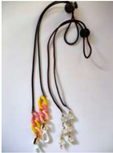
Gambar 5. Strap Masker yang Dhasilkan