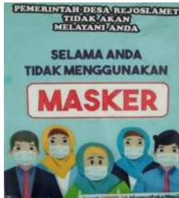
Gambar 2. Poster Himbauan Menggunakan Masker