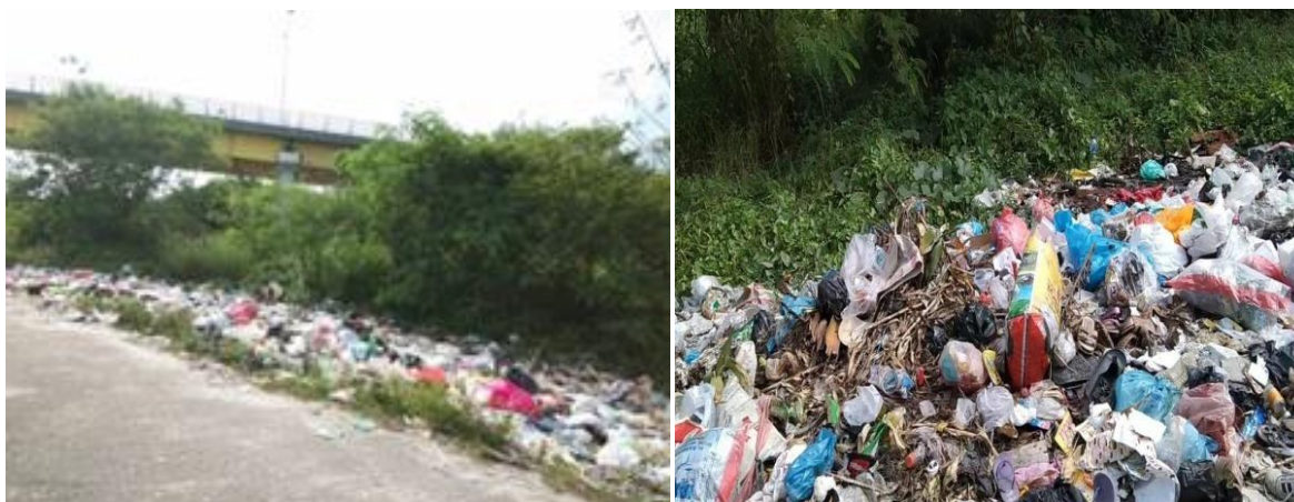
Gambar 1. Sampah yang dibuang sembarangan di tepi jalan RT 01 RW 08 Kelurahan Meranti Pandak, Rumbai Pesisir

RT 01 RW 08 Meranti Pandak Rumbai Pesisir merupakan daerah di pinggiran sungai Siak, yaitu sungai terpanjang di Riau dengan masyarakat ekonomi menengah kebawah, dan termasuk salah satu kecamatan yang ada di Kota Pekanbaru. Menurut sudrajat, 2007 bahwa perkembangan dan pertumbuhan penduduk yang semakin pesat di daerah perkotaan mengakibatkan daerah pemukiman semakin luas dan padat. Sehingga sebagian besar masyarakatnya masih belum bisa memanfaatkan fasilitas yang ada dan menciptakan lingkungan yang bersih untuk masyarakat lainnya. Banyaknya masyarakat yang tidak peduli dengan lingkungan menjadikan permasalahan semakin parah, sehingga masyarakat lainnya yang telah menerapkan pola hidup sehat mendapatkan imbasnya. Masyarakat banyak mengeluhkan kondisi lingkungan yang tidak nyaman serta kondisi kesehatan yang semakin memburuk.