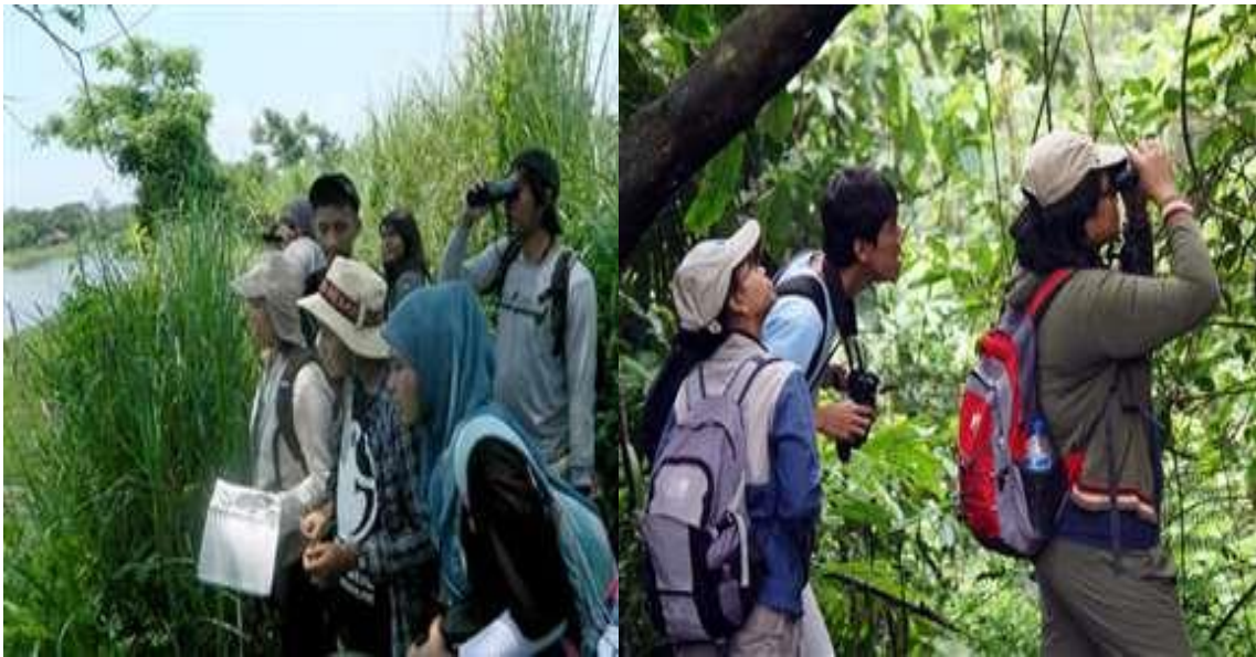
Gambar 3. Pengamatan burung yang dilakukan oleh calon pemandu wisata burung (masyarakat setempat) di Hutan Larangan Adat Kenegarian Rumbio Kabupaten Kampar