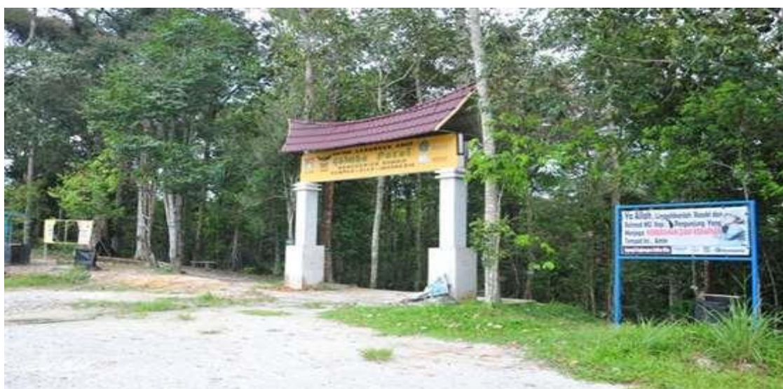
Gambar 1. Pintu gerbang hutan larangan adat Ghimbo Potai Kenegarian Rumbio Kabupaten Kampar

Kawasan Hutan yang dijuluki sebagai “Hutan Larangan” Ghimbo Potai, yang berada di Kenegerian Rumbio Kabupaten Kampar. Secara administratif, kawasan hutan ini terletak di empat desa yakni Rumbio, Padang Mutung, Pulau Sarak, Koto Tibun, semuanya di wilayah Kecamatan Kampar, Kabupaten Kampar, Riau. Seiring berjalannya waktu, Hutan Larangan ini semakin diminati sebagai salah satu tujuan wisata. Hutan larangan adat Rumbio merupakan salah satu hutan adat yang memiliki penerapan kearifan lokal oleh masyarakat adatnya. Hutan larangan adat ini memiliki keanekaragaman hayati yang tinggi dan masyarakat yang sangat menghormati peraturan-peraturan adat. Kelembagaan adat yang berada di sekitar hutan larangan adat Rumbio memiliki tujuan dan fungsi untuk menjaga kelestarian hutan adat dan lingkungan.