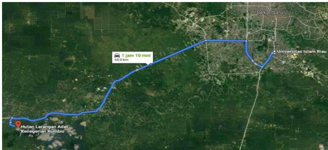
Gambar 2. Lokasi pengabdian kepada masyarakat di Hutan Larangan Adat Kenegarian Rumbio Kabupaten Kampar

Lokasi kegiatan Pengabdian Pada Masyarakat dilaksanakan di Hutan Larangan Adat Kenegarian Rumbio Kabupaten Kampar.