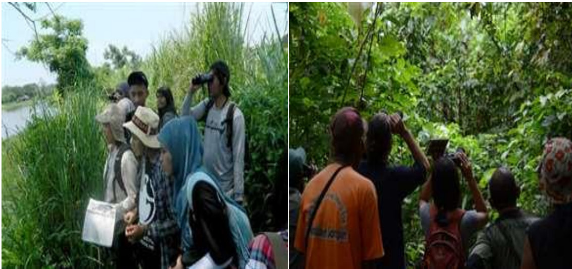
Gambar 4. Pengamatan burung di lokasi sekitar Hutan Larangan Adat Kenegarian