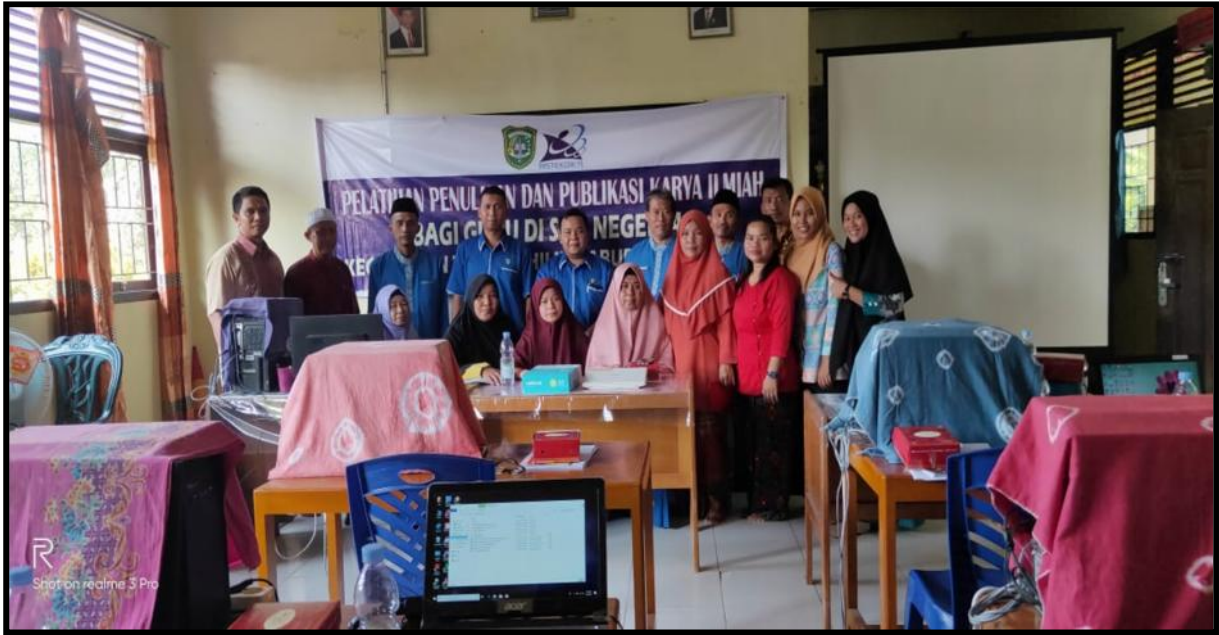
Gambar 1. Foto Bersama dengan Peserta Pengabdian kepada Masyarakat