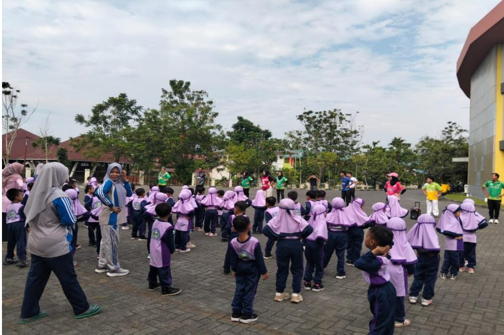
Gambar 2: Anak TK Senam Bugar Ceria