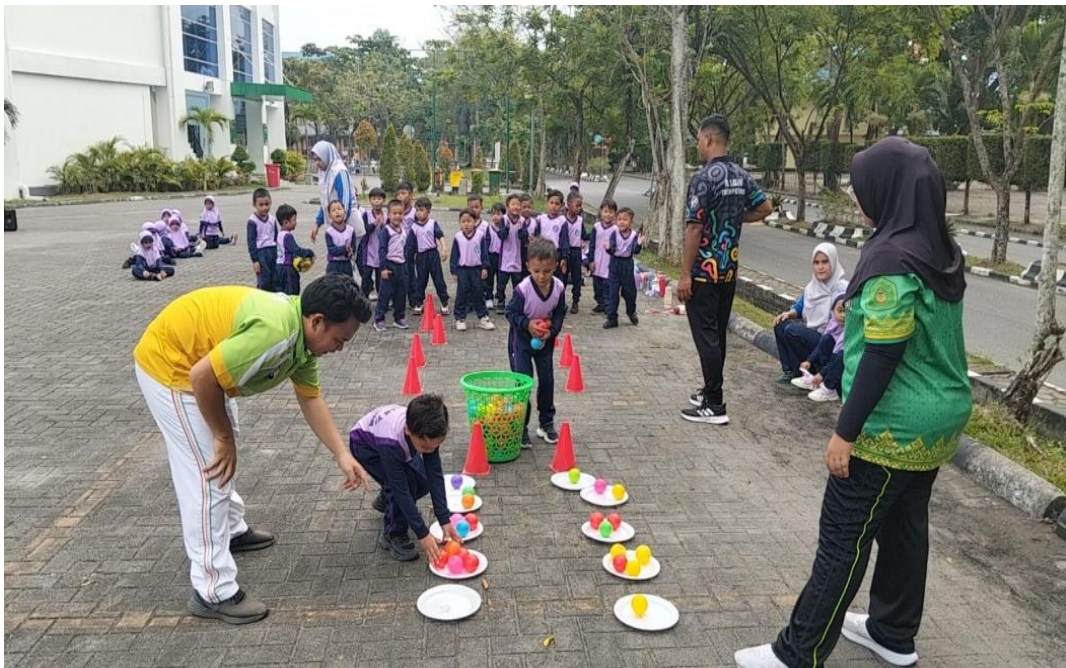
Gambar 3: Permainan Bola Warna dan Angka

Setelah berhasil, anak kembali ke garis start dan memberi giliran pada temannya.