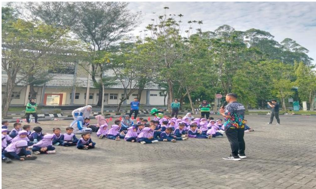
Gambar 1: Dosen dan Tim PkM menjelaskan bentuk permainan

Dosen dan tim menjelaskan beberapa permainan agar anak TK memahami setiap gerakan dan permainan yang di intruksikan oleh tim PkM. Kegiatan PkM ini guna merangsang motorik anak agar semangat untuk bergerak, unsur permainan yang buger dan ceria membuat mereka antusias dalam melakukan berbagai permainan.