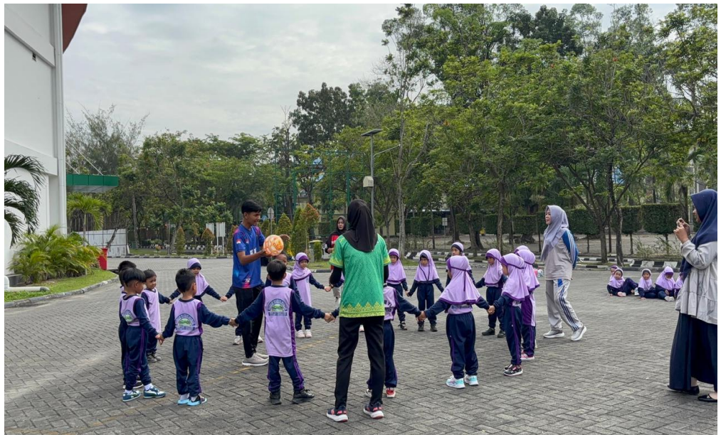
Gambar 4: Permainan Lempar Tangkap Bola Karet