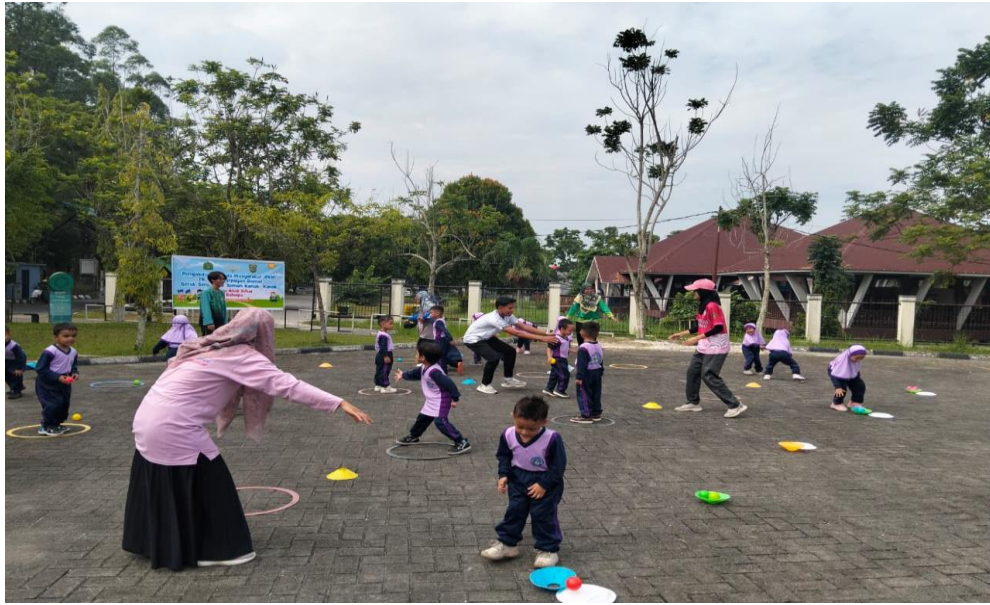
Gambar 5: Permainan Estafet Bola Ceria

Kegiatan ini menerapkan prinsip pembelajaran aktif, di mana anak belajar melalui pengalaman langsung, bermain bersama, dan eksplorasi gerak. Evaluasi dampak kegiatan dilakukan melalui pengukuran perkembangan motorik kasar anak sebelum dan sesudah intervensi. Dengan penerapan IPTEKS yang tepat guna dan berbasis kebutuhan masyarakat mitra, program ini diharapkan mampu memberikan kontribusi nyata terhadap tumbuh kembang anak usia dini, sekaligus meningkatkan kapasitas guru dan orang tua dalam mendampingi proses belajar anak secara aktif dan menyenangkan.