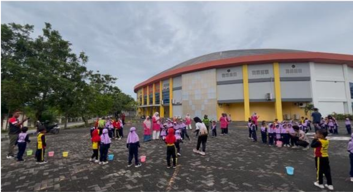
Gambar 5: Siswa/i Taman Kanak-Kanak (TK) YLPI melakukan gerakan memindahkan bola dari keranjang besar ke keranjang kecil sesuai dengan warna keranjang yang sudah ditentukan.