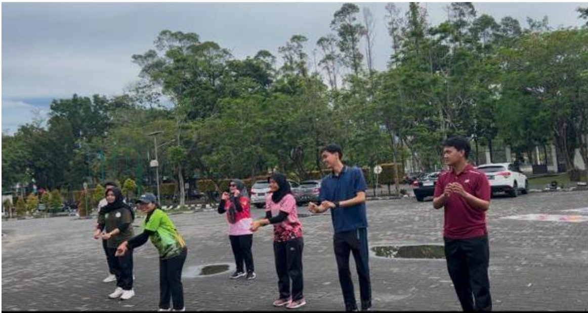
Gambar 2: Para instruktur senam mencontohkan gerakan agar ditiru oleh siswa/i Taman Kanak-Kanak (TK) YLPI