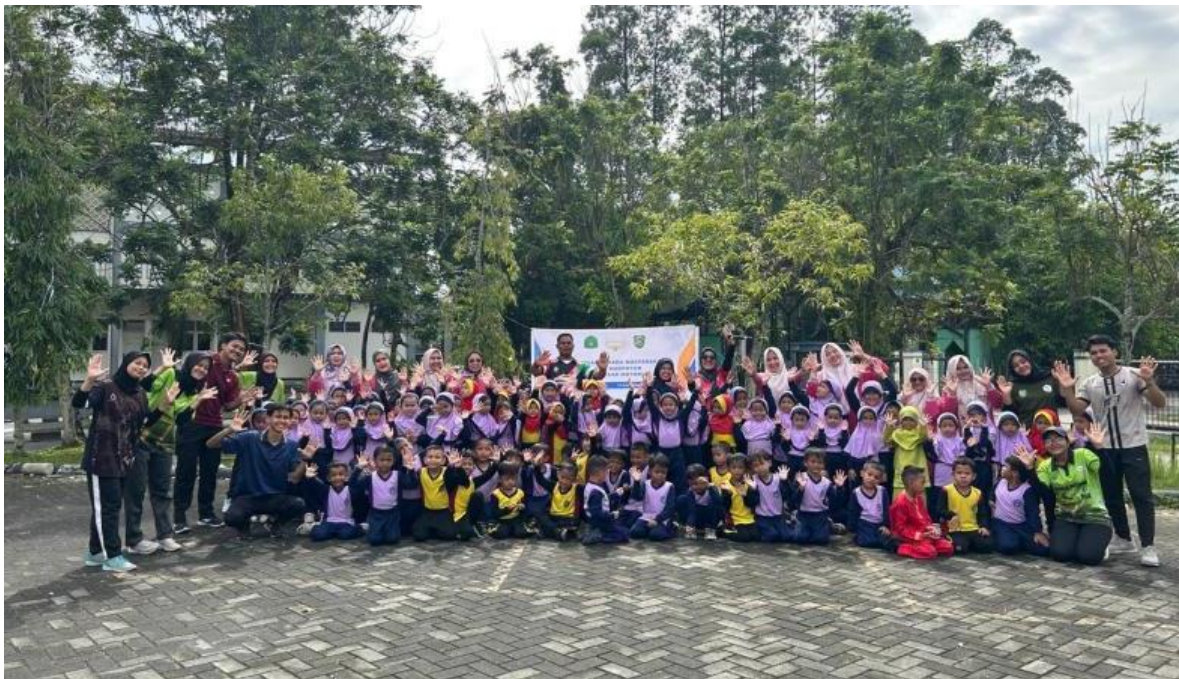
Gambar 7: Foto Bersama siswa/i Taman Kanak-Kanak (TK) YLPI

Berdasarkan hasil observasi selama kegiatan pengabdian berlangsung, ditemukan bahwa anak-anak memperoleh pemahaman yang lebih baik mengenai gerak dasar motorik, baik dari segi teori maupun praktik, termasuk penjelasan tentang motorik kasar dan