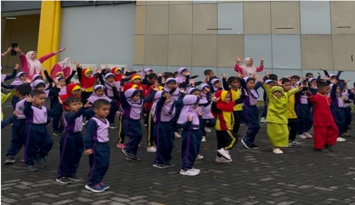
Gambar 1: Siswa/i Taman Kanak-Kanak (TK) YLPI sedang melakukan pemanasan dengan gerakan senam sebelum memulai tes gerak dasar motorik.