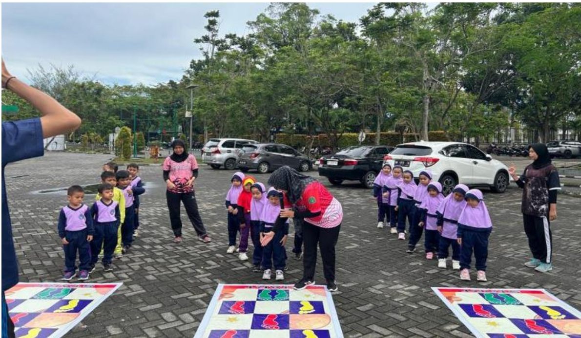
Gambar 4: Siswa/i Taman Kanak-Kanak (TK) YLPI melakukan gerakan melompat sesuai dengan warna dan sesuai dengan arahan kaki kiri atau kanan pada spanduk yang telah disediakan.