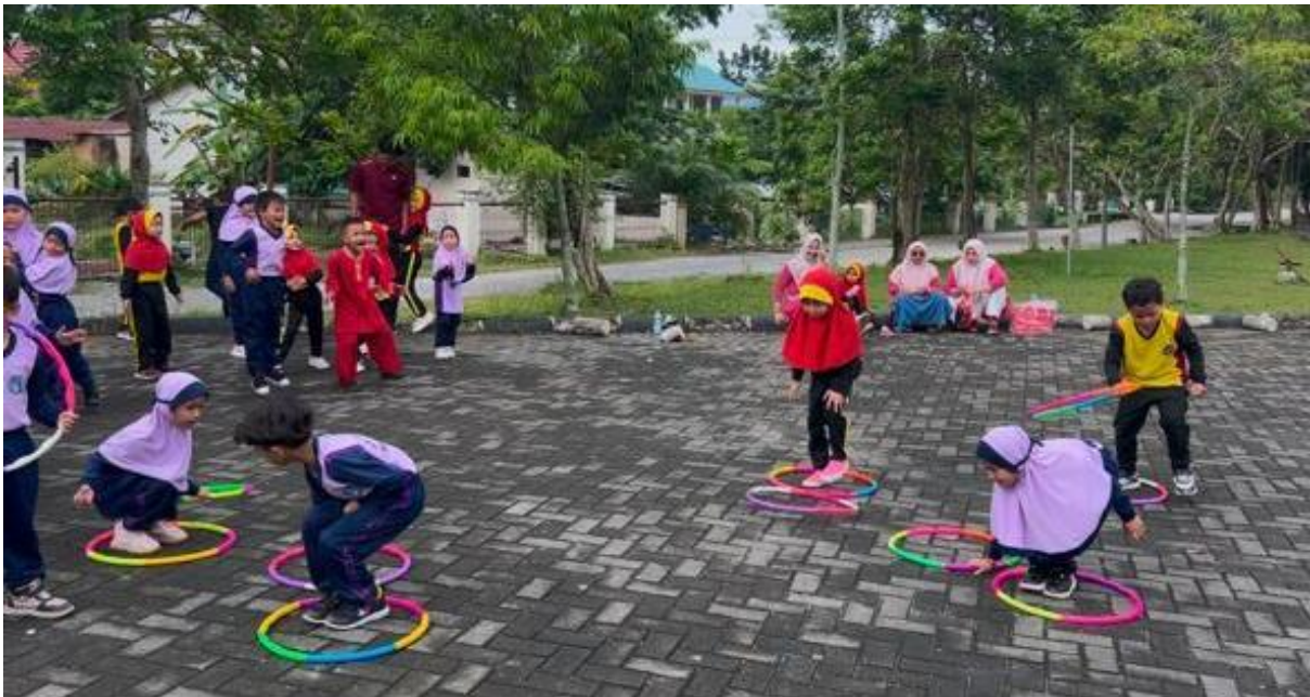
Gambar 4: Siswa/i Taman Kanak-Kanak (TK) YLPI melakukan permainan memindahkan Hula-Hup dari satu titik awal ke titik akhir dengan jalur yang lurus