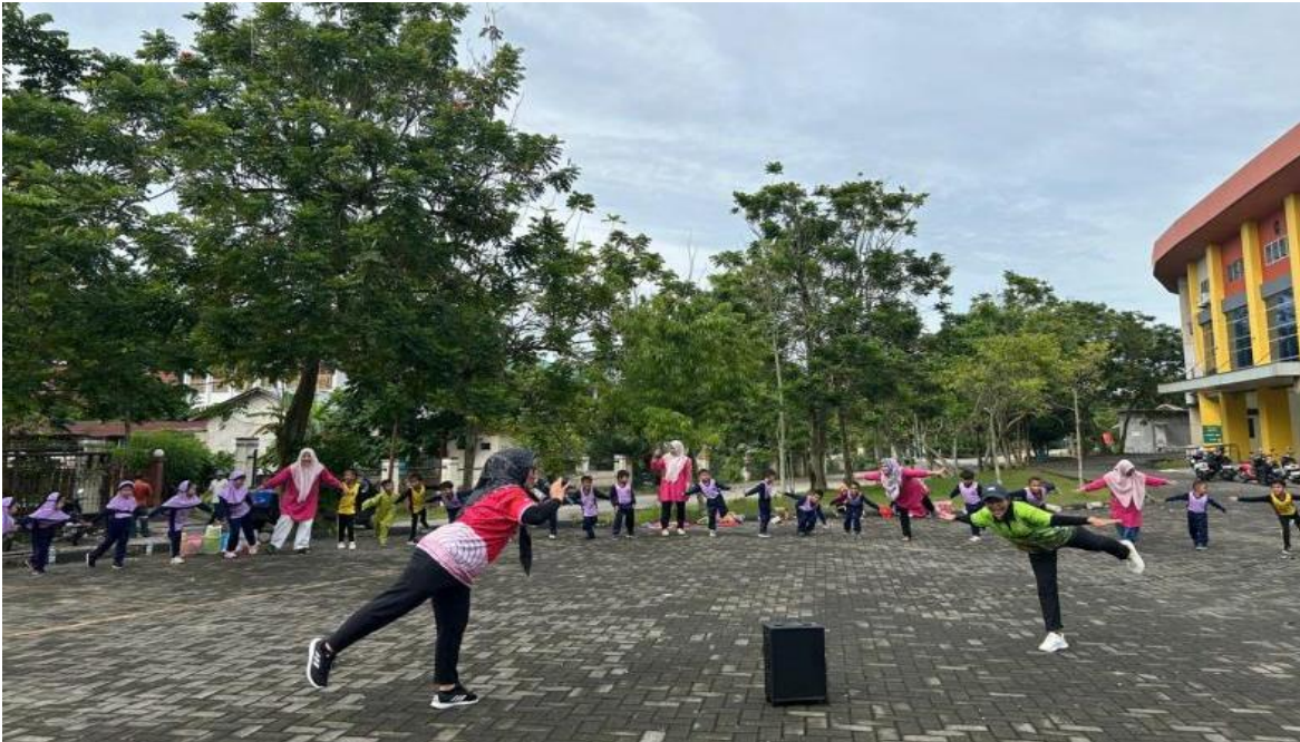
Gambar 3 : Siswa/i Taman Kanak-Kanak (TK) YLPI melakukan gerakan keseimbangan yang merupakan salah satu tes gerak dasar motorik anak