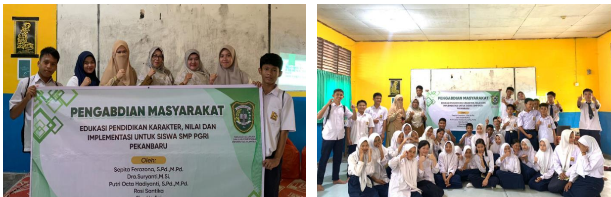
Gambar 2. Foto bersama Guru dan Siswa setelah pengabdian selesai

Sekolah memuji hasil pengabdian. Pihak sekolah berharap kegiatan ini dapat dilanjutkan untuk meningkatkan kualitas sumber daya manusia di sekolah dengan membantu siswa berperilaku baik.