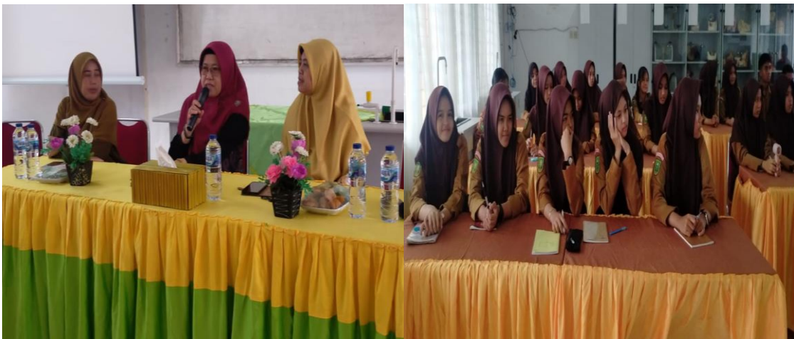
Gambar 1. Foto Kegiatan Acara Penyuluhan Peduli lingkungan

Tahap Penyuluhan; di tahap ini sebelum kegiatan tim dipersilakan menunggu di ruang kepala sekolah sementara Wakur mengecek ruang yang akan digunakan setelah siap tim dan kepala sekolah menuju ruang untuk melakukan penyuluhan dengan materi peduli lingkungan membangun karakter untuk mengurangi limbah plastik pada siswa SMP Negeri 9 Pekanbaru. Siswa/i sangat antusias dan perhatian pada waktu materi disampaikan, lalu diadakan tanya jawab dan hal-hal yang berhubungan dengan materi. Diharapkan dengan penyuluhan ini secara karakter akan terbangun dengan baik serta terbuka secara berpikir bahwa peduli akan lingkungan akan berdampak positif dan mengurangi dampak negatifnya. Untuk lebih jelas lihat gambar 1 di bawah ini sebagai dokumentasi kegiatan;