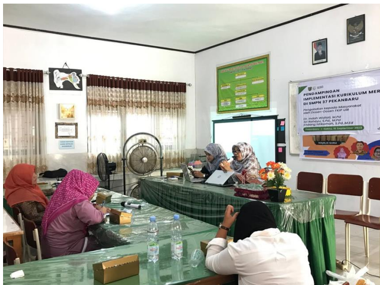
Gambar 6. Pendampingan kepada Peserta Pengabdian Masyarakat