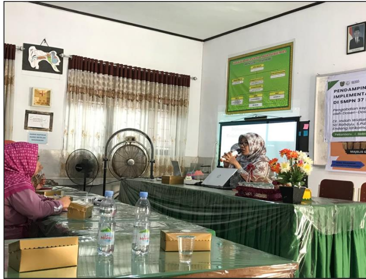
Gambar 4. Penyampaian Materi oleh Tim Pengabdian Masyarakat