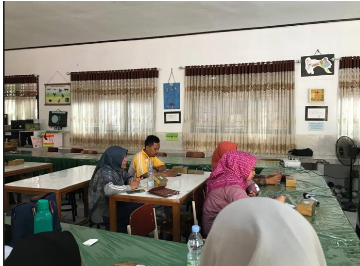
Gambar 5. Diskusi Peserta dengan Tim Pengabdian Masyarakat