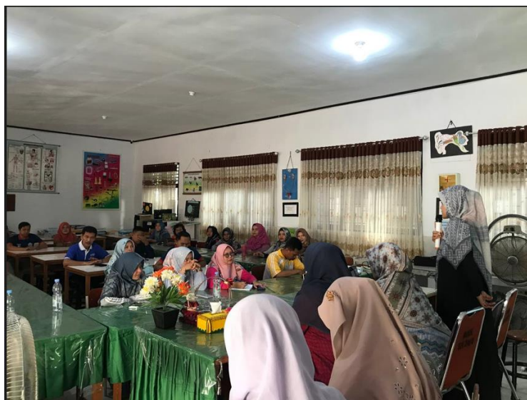
Gambar 7. Evaluasi Proses kepada Peserta Pengabdian Masyarakat

Proses yang dilakukan berjalan dengan lancar dan dihadiri oleh lebih dari 85% jumlah guru di SMPN 37 Pekanbaru. Namun ada beberapa guru yang terpaksa tidak mengikuti kegiatan sampai akhir karena harus mendampingi siswa. Berikut adalah dokumentasi kegiatannya pelaksanaan pengabdian masyarakat: