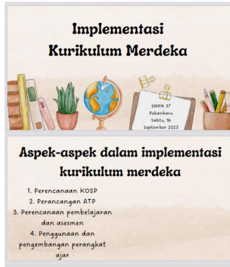
Gambar 2. Contoh Materi Pengabdian Masyarakat