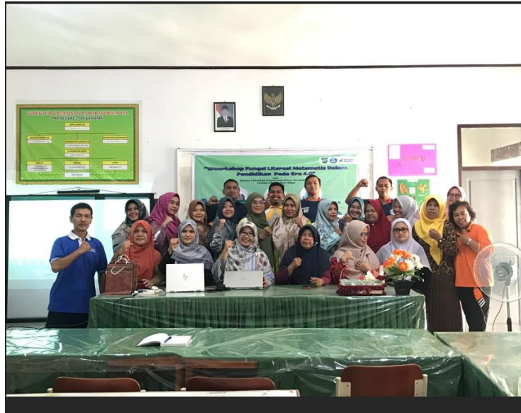
Gambar 8. Evaluasi Proses Tahap Akhir