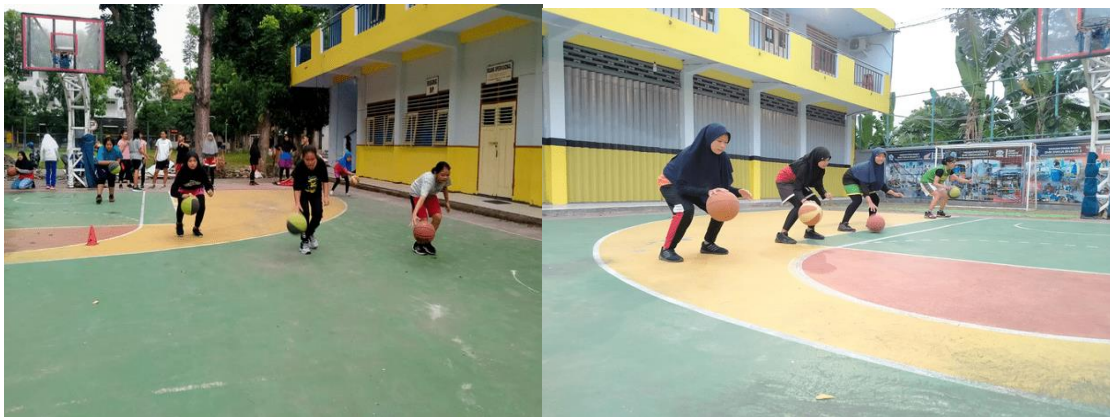
Gambar kegiatan latihan teknik dasar 1

Setiap pemain harus menguasai teknik dasar permainan bolabasket dribbling, passing, shooting, di dalam bola basket menggiring bola merupakan hal yang tidak bisa di pisahkan pada setiap individu maupun tim, karena menggiring bola merupakan usaha setiap pemain untuk membawa bola ke depan sebagai tugas utama. Kunci dari semua keberhasilan dalam menyerang untuk setiap tim berdasarkan kemampuan passing pemain karena hal tersebut salah satu indikator setiap tim punya peluang untuk mendapatkan angka, setiap passing pemain harus dilaksanakan dengan cepat dan akurat itu termasuk kunci utama dan mempunyai kesempatan dalam memasukkan bola ke dalam ring. Untuk kemampuan shooting bisa dikatakan sebagai usaha sebuah tim atau pemain dalam memasukkan bola ke dalam ring sebanyak – banyaknya. Sehingga bisa dikatakan bahwa hasil dari bentuk latihan teknik dasar yang dilakukan saling berkaitan satu sama lain dari teknik dasar tersebut, bentuk latihan tersebut dapat menunjang kemampuan individu setiap pemain dan berdampak baik terhadap sebuah tim.