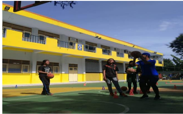
Gambar kegiatan latihan teknik dasar 2

Implikasi untuk pengabdian ini berdampak pada pemain dengan beraktivitas gerak berdasarkan teknik dasar dengan lancar dan benar. Dengan kegiatan ini berdampak positif dengan pentingnya belajar teknik dasar sejak kecil supaya memberi pengaruh kedepannya dengan latihan secara terus-menerus dengan baik. Pemain harus aktif melakukan gerakan dalam permainan bola basket dengan menerapkan teknik yang benar supaya berdampak terhadap prestasi melalui permainan bola basket.