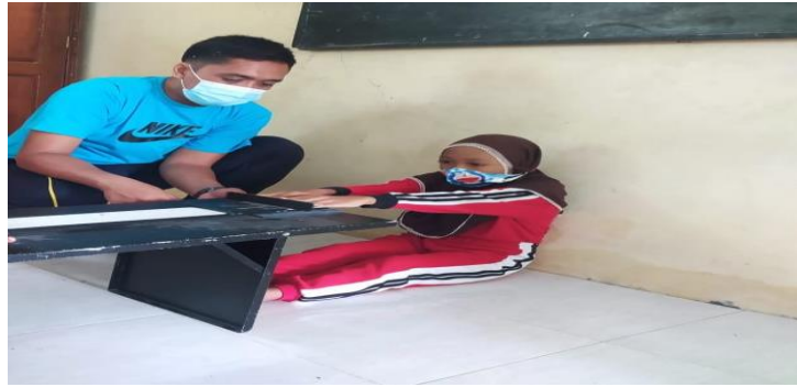
Gambar 1. Pengambilan tes