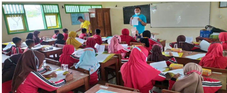
Gambar 2. Kegiatan penyuluhan