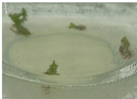
Gambar 1. Perlakuan B2N2 BAP 4 ppm, NAA 1 ppm saat umur 27 HST.

Pemberian NAA secara tunggal menunjukkan perlakuan terbaik terdapat pada N2 (NAA 1,0 ppm) yaitu 30,62 hari Hal ini dikarenakan NAA adalah sejenis hormon auksin yang berfungsi untuk merangsang pertumbuhan tunas-tunas baru karena auksin terdapat pada pucuk-pucuk tunas muda atau pada jaringan meristem di pucuk, hormon auksin juga berfungsi untuk merangsang daya kerja akar sehingga dapat memenuhi kebutuhan makanan untuk pertumbuhan tunas.