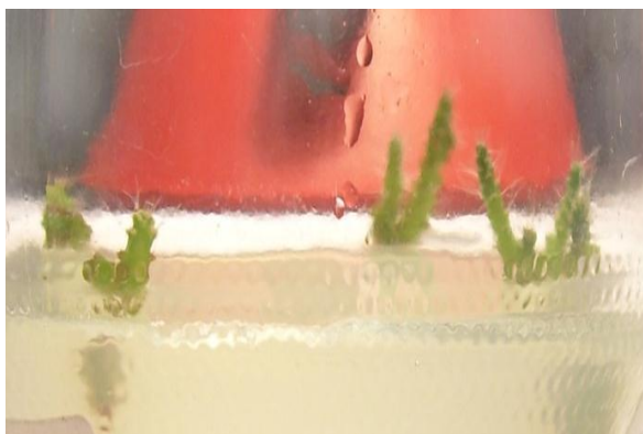
Gambar 2. Eksplan Buah Naga Umur 3 Bulan Perlakuan B3N2 (BAP 6 ppm dan NAA 1 ppm) Menghasilkan Rata-rata 1,63 Tunas.

bergantung pada sumber jaringan serta kadar medium hara. Tingginya kemampuan jaringan untuk tumbuh, tergantung pada kemampuan auksin dan sitokinin yang ditambahkan ke dalam media untuk merubah zat pengatur tumbuh endogen dalam sel.