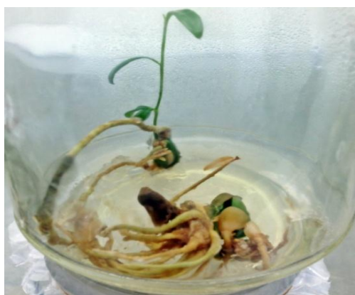
Gambar 3. Kultur dengan Jumlah Akar Terbanyak Perlakuan K 0 A 0,5

Selain itu, konsentrasi auksin yang digunakan dalam percobaan ini juga relatif rendah yakni 0,5-2 mg.l -1 , Hal ini sesuai dengan pendapat Skoog dan Miller (1975) bahwa untuk perakaran secara in vitro biasanya digunakan auksin dalam konsentrasi rendah.