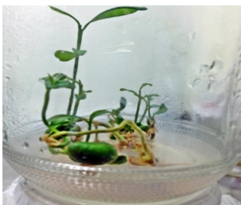
Gambar 2. Kultur dengan Jumlah Tunas Terbanyak Perlakuan K 3 A 2 (A)