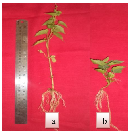
Gambar 3. Morfologi Pertumbuhan Mikania micrantha ; (a). Kontrol; (b). Mulsa M. bracteata 2,5 cm.