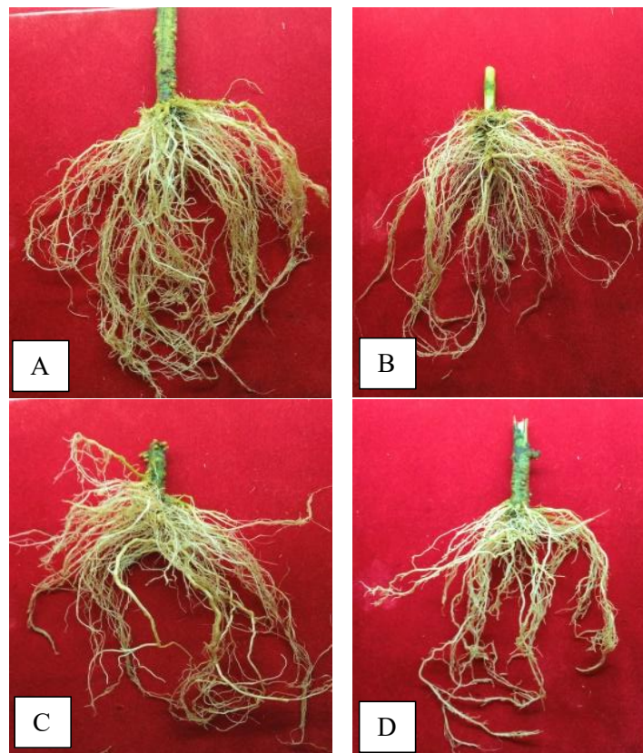
Gambar 2. Tampilan akar tanaman tomat yang diberi perlakuan Trichoderma A. isolat asal Sungai Nanam; B. isolat asal Tabek Patah; C. isolat asal Salimpaung; D. Kontrol/Tanpa isolat Trichoderma

penetrasi larva nematoda Meloidogyne spp. ke dalam akar. Penelitian Winarto et al. (2018), Trichoderma dapat menghasilkan senyawa toksik yang melumpuhkan larva nematoda sebelum mencapai ujung akar. Selain itu, kolonisasi Trichoderma di permukaan akar menciptakan kompetisi ruang yang menghambat nematoda menemukan situs penetrasi.