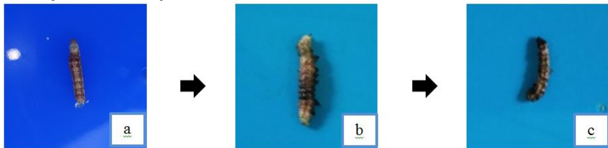
Gambar 1. Perubahan Morfologi Larva H. armigera dengan Pemberian Ekstrak Tepung Daun Babadotan (A) Larva yang Sehat (B) Larva yang Telah Mati 6 Jam Setelah Aplikasi (c) Larva yang Telah Mati 43 Jam Setelah Aplikasi (Dokumentasi penelitian, 2019)

selanjutnya terjadi 43 jam setelah aplikasi tubuh larva mengeluarkan cairan berwarna putih kekuningan kemudian tubuh larva menjadi keras. Selanjutnya warna tubuh larva berubah menjadi warna hitam diseluruh bagian tubuh. Perubahan morfologi tubuh larva H. armigera yang dapat dilihat pada Gambar 1.