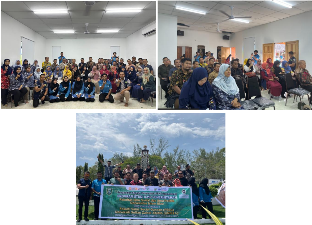
Figure 3. Pelaksanaan Pengabdian

Dari model solusi diatas salah satu bentuk kolaboratif dalam anti kemiskinan melalui pemanfaata teknologi. Ini sesuai dengan Riset yang penulis lakukan , dimana Penggunaan e - government dalam pengolahan data kemiskinan untuk bantuan sosial menghadapi kendala terkait kesiapan teknologi dan pengetahuan teknologi(Fikri et al. , 2023). Penelitian ini menekankan pentingnya penerimaan dan kompatibilitas teknologi untuk e - government dalam aplikasi data kemiskinan(Fikri et al. , 2023).