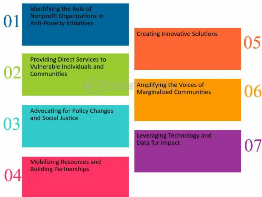
Figure 2 Exploring Cross-sector Collaboration in Anti-Poverty Initiatives: Harnessing the Power of Nonprofit Organizations in Anti-Poverty Initiatives

Oleh karena itu, penting kiranya menajajaki Kolaborasi Lintas Sektor dalam Inisiatif Anti-Kemiskinan seperti gambar berikut :