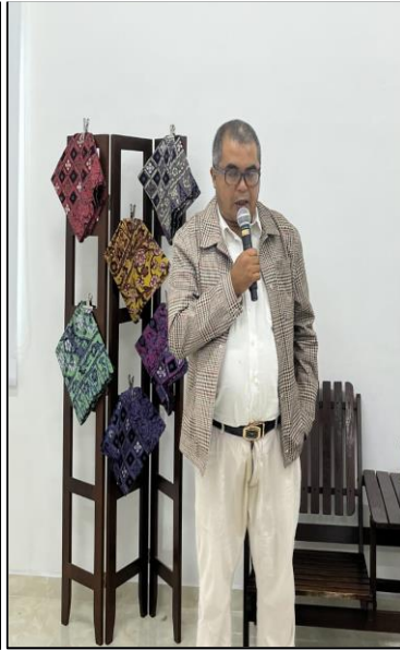
Gambar.2. Sambutan Perwakilan Universitas Islam Riau