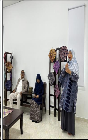
Gambar.3. Sambutan Pengelola Sanggar Lambosari Negeri Terengganu

Setelah dilakukan rangkaian pembukaan tersebut, kegiatan berikutnya adalah penyuluhan dan sosialisasi oleh masing-masing tim pengabdian sesuai dengan tema yang sudah ditetapkan. Tema tentang literasi disampaikan dengan menayangkan slide powerpoint oleh tim pengabdian, dengan menguraikan kondisi masyarakat saat ini yang sangat rendah budaya literasinya baik dalam membaca buku maupun literasi digital, serta masih minimnya pemberian motivasi dan sosialisasi yang dilakukan baik oleh pemerintah maupun Lembaga-lembaga diluar pemerintah.