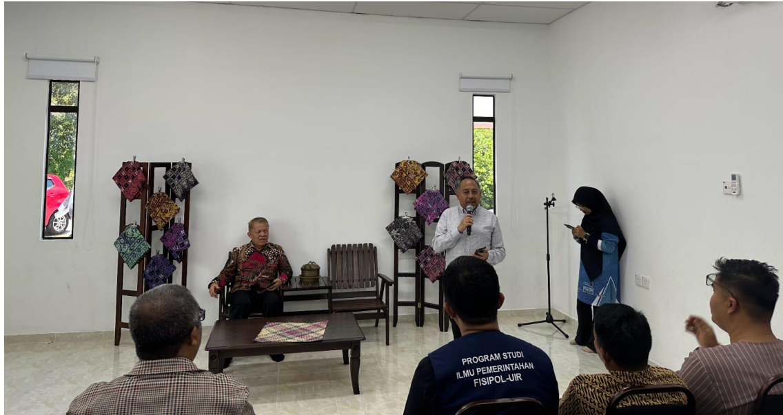
Gambar.4. Penyampaian materi