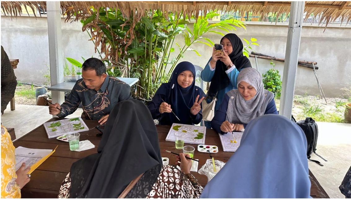
Gambar.6. Mewarnai batik tulis

Kegiatan pengabdian ini ditutup dengan penyerahan cenderamata dari narasumber kepada perwakilan peserta pengabdian dan dilanjutkan dengan foto Bersama. Untuk melihat respon masyarakat peserta dilakukan penyebaran angket untuk melihat kepuasan mitra terhadap kegiatan yang sudah dilakukan, serta untuk bahan evaluasi bagi tim pengabdian.