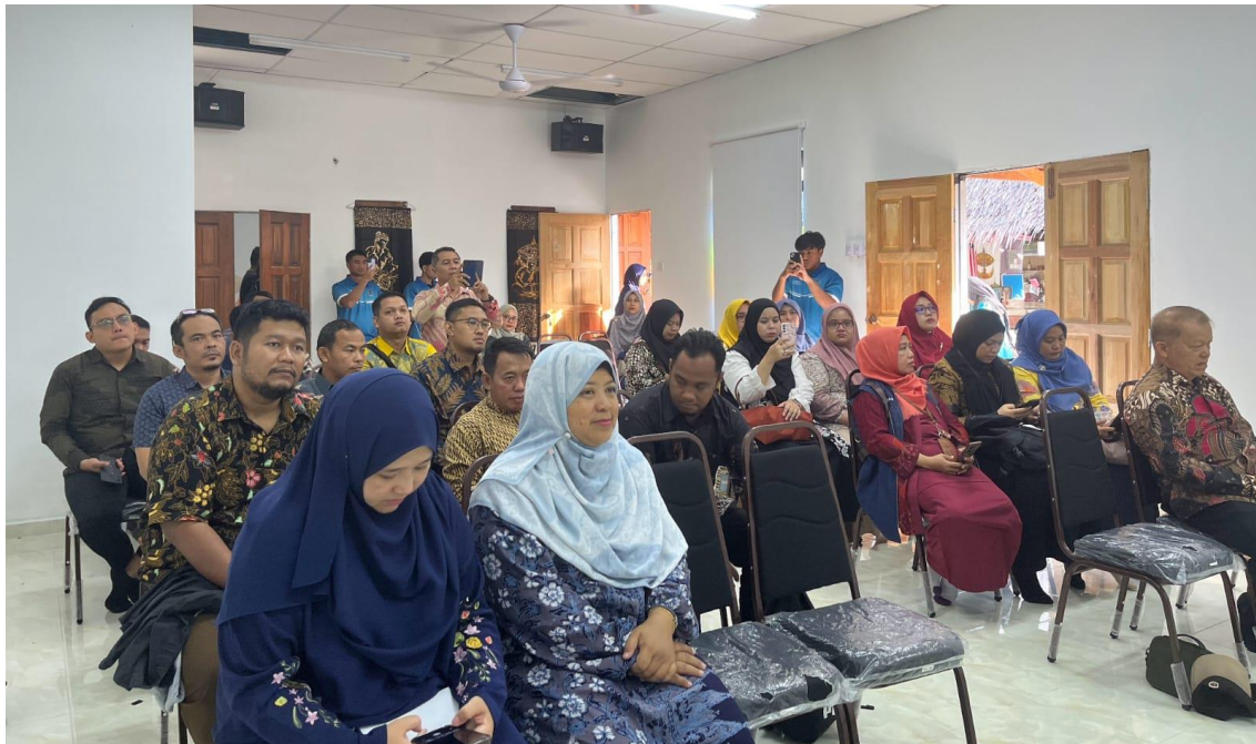
Gambar.5. Peserta pengabdian

Selanjutnya, sanggar Lambosari mengajak semua tim pengabdian untuk mencoba kegiatan yang mereka taja yaitu Teknik membuat dengan metode tulis dan stempel, serta membuat adonan kue yang menjadi ciri khas daerah Kampung Telaga Daing tersebut.