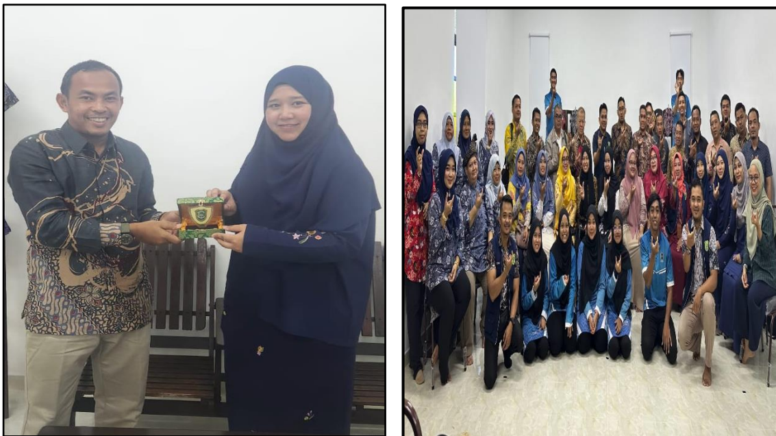
Gambar.7. Penyerahan cenderamata dan foto bersama

Kegiatan pengabdian ini ditutup dengan penyerahan cenderamata dari narasumber kepada perwakilan peserta pengabdian dan dilanjutkan dengan foto Bersama. Untuk melihat respon masyarakat peserta dilakukan penyebaran angket untuk melihat kepuasan mitra terhadap kegiatan yang sudah dilakukan, serta untuk bahan evaluasi bagi tim pengabdian.