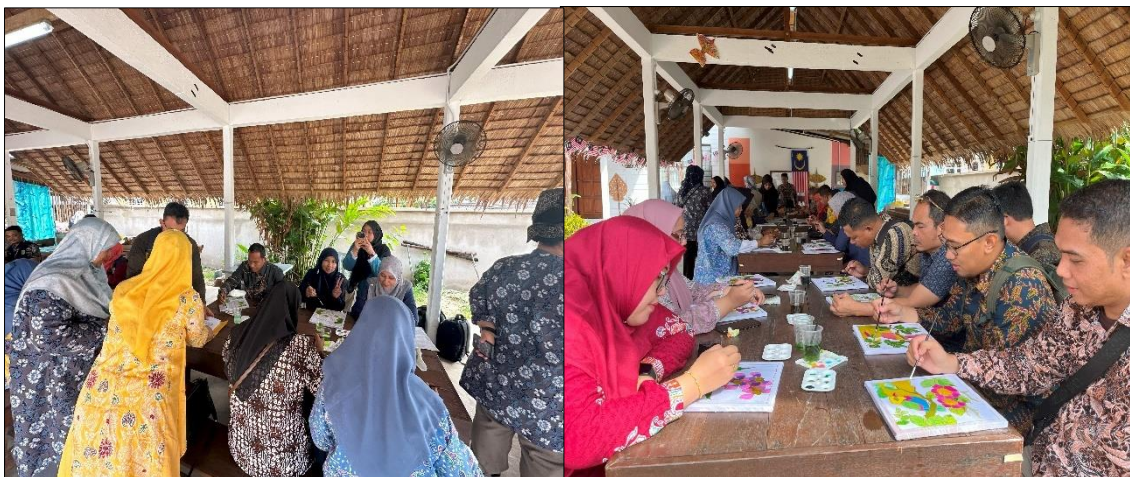
Gambar 4. Salah satu bentuk tindak lanjut kegiatan pengabdian masyarakat yakni pelastarian nilai budaya lokal dengan metode sosialisasi dan pelatihan yang memiliki dampak ekonomi

Secara keseluruhan, pelaksanaan kegiatan ini telah memberikan dampak positif terhadap kondisi sosial dan ekonomi mitra, yang dapat dilihat melalui peningkatan produktivitas dan efektifitas kegiatan pemerintahan Kampung Telaga Daing. Kampung Telaga Daing terdapat “Lambo Sari” sebagai platform bagi mengendalikan aktivitas alami dan interaktif seni, menyediakan ruang eksplorasi pengalaman kebudayaan Terengganu dan akan menjaga reputasi seni dan budaya. Dari aspek ekonomi penguatan tata Kelola pemerintahan berbasisi budaya lokal diharapkan mampu meningkatkan taraf kehidupan Masyarakat. Secara langsung kegiatan ini telah memberikan dampak positif dalam aspek sosial, terutama dalam peningkatan kesadaran masyarakat akan pentingnya melestarikan nilai budaya lokal dan memperbaiki tata kelola pemerintahan di tingkat kampung. Berikut adalah data yang menunjukkan dampak sosial kegiatan: