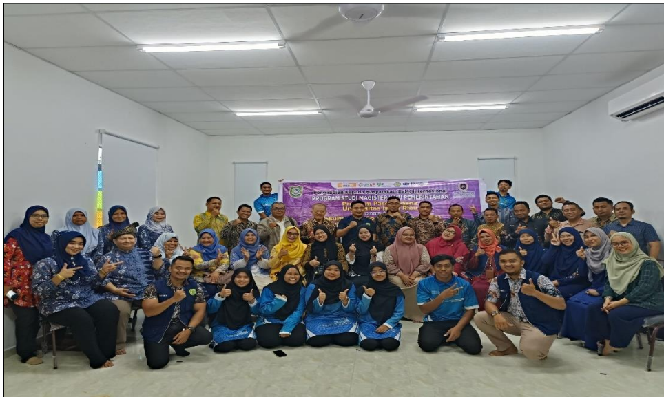
Gambar 2. Foto Bersama Tim Pengabdian Masyarakat Internasional dan Masyarakat Kampung Telaga Daing, Negara Bagian Terengganu Darul Iman, Malaysia

Pelaksanaan kegiatan pengabdian masyarakat dengan judul Penguatan Tata Kelola Pemerintahan Kampung Telaga Daing melalui Pelestarian Nilai Budaya Lokal di Negara Bagian Terengganu Darul Iman, Malaysia telah terselenggara dengan baik. Berbagai pihak telah mendukung terlaksananya program diantaranya pemerintah kampung Telaga Daing, Masyarakat kampung dan pihak Universiti Sultan Zainal Abidin. Kegiatan ini merupakan bentuk kolaborasi antara Universitas Islam Riau (UIR) dengan Universiti Sultan Zainal Abidin (UniSZA) sebagai tindak lanjut dari Kerjasama internasional. Kegiatan pengabdian internasional ini terdiri dari beberapa tim yang memiliki judul dan fokus yang berbeda dalam pelaksanaannya. Pelaksanaan program dilaksanakan pada hari Selas-Rabu, tanggal 07-08 Oktober 2024 bertempat di Lambo Sari, Jalan Ketapang, Kampung Telaga Daing Kuala Terengganu, Terengganu, Malaysia.