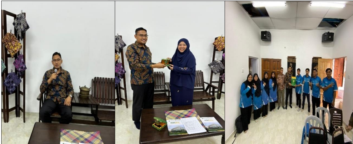
Gambar 3. Pelaksanaan Program Sosialisasi dan Pelatihan, serta dilanjutkan dengan pemberian cenderamata sebagai bentuk komitmen keberlanjutan pogram pengabdian kepada Masyarakat

memberi cenderamata sebagai bentuk kenang-kenangan dan keberlanjutan komitmen baik dari UniSZA, Pejabat Pemerintah Kampung Telaga Daing dan Universitas Islam Riau.