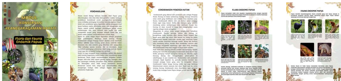
Gambar 1. Tampilan cover dan Isi modul