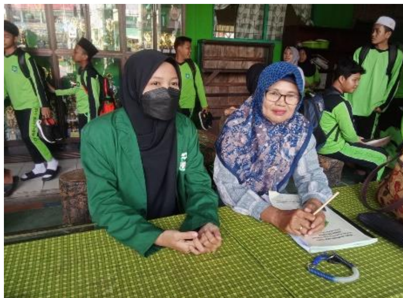
Gambar 1. Kegiatan Konsultasi Muhadharah

muhadarah maka siswa saya berani, mudah memahami, serta menghargai teman sebayanya). Hasil wawancara bersama wali kelas VII A.