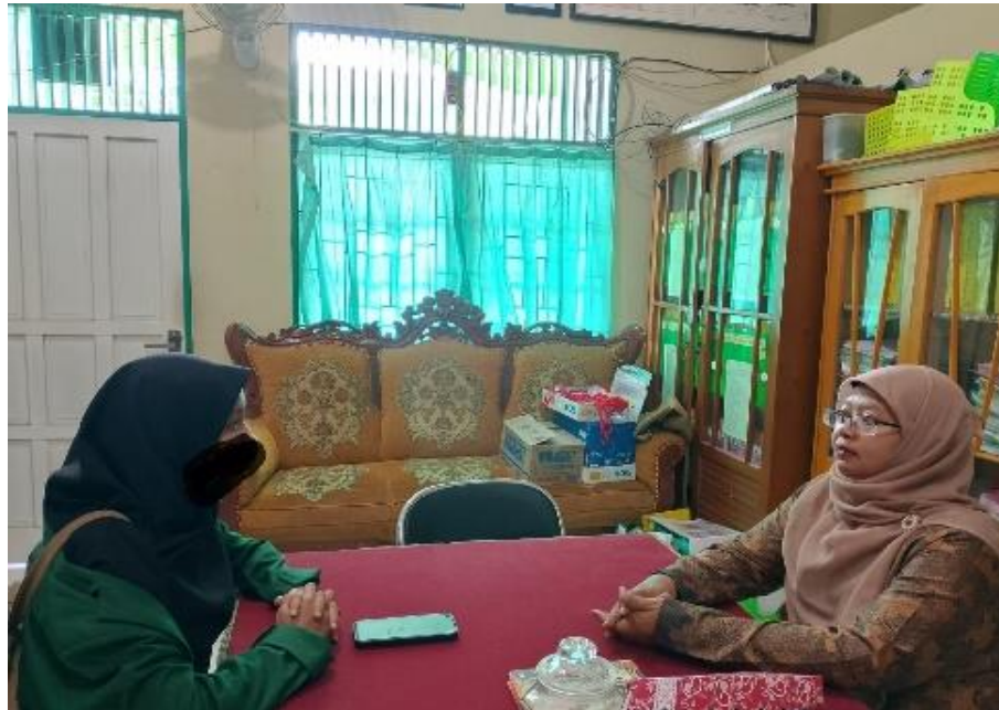
Gambar 1. Kegiatan Konsultasi Muhadharah

wawancara bersama guru pelatih/guru keagamaan.