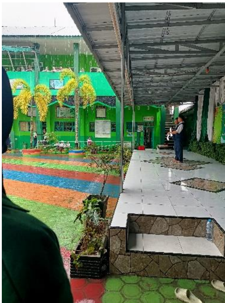
Gambar 1. Kegiatan Muhadharah

(kutipan wawancara informan Wali kelas sebagai menentukan pembagian tugas pada siswanya disini peneliti mengamati peran wali kelas dari kelas VIII A. Wali kelas menyiapkan serta melatih siswa yang telah ditentukan masing-masing siswa dengan tugas yang ditanggungjawabkan. Dari kelas VIII A ada 30 siswa. Guru agama disini berperan untuk melatih siswa dalam perihal agama kegiatan muhadarah. setelah melakukan pelatihan maka akan dilakukannya kegiatan muhadarah setelah dua minggu ditampilkan didepan umum ditonton semua pihak sekolah dan dilaksanakan dilapangan sekolah dengan disediakan fasilitas dalam kegiatan muhadarah. Setelah pelaksanaan