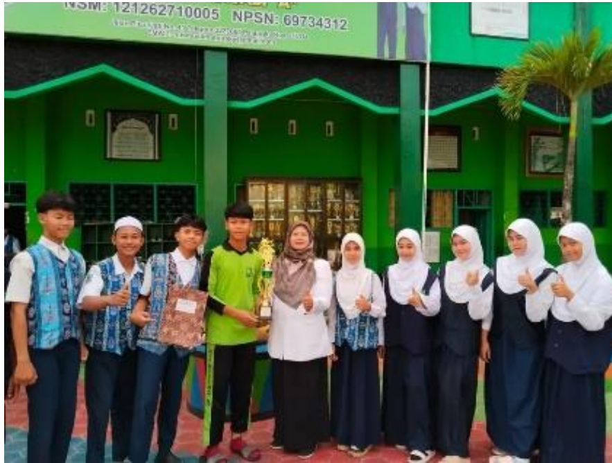
Gambar 1. Kegiatan Bersama setelah Muhadharah

(Hasil Wawancara juga.. terbukti bahwasannya dengan adanya kegiatan muhadarah maka mempermudah siswa untuk karakter yang baik serta