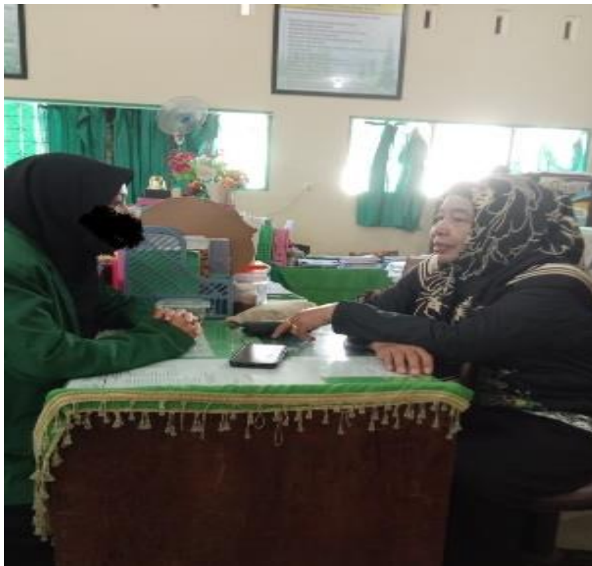
Gambar 1. Kegiatan Konsultasi Muhadharah

keterampilan komunikasi yang baik yang banyak memberikan manfaat pada siswa). Hasil wawancara dengan koordinator muhadarah.