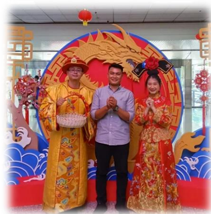
Gambar 1. 2