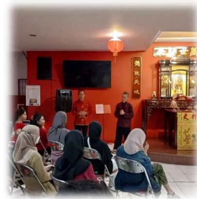
Gambar 1. 10