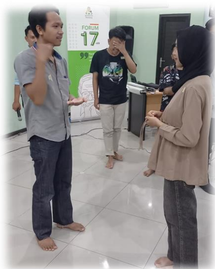
Gambar 1. 6