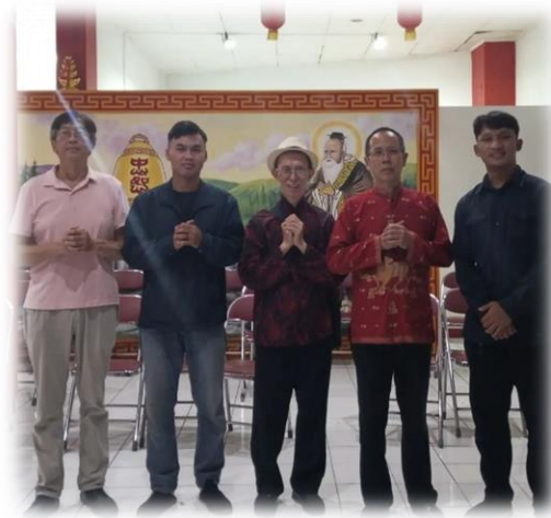
Gambar 1. 9