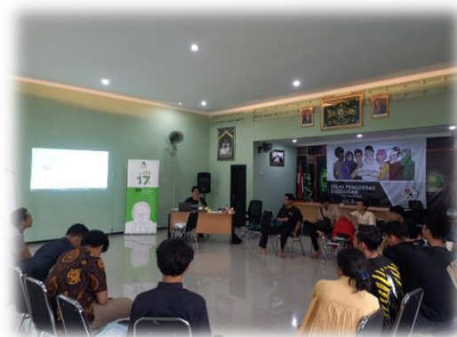
Gambar 1. 7