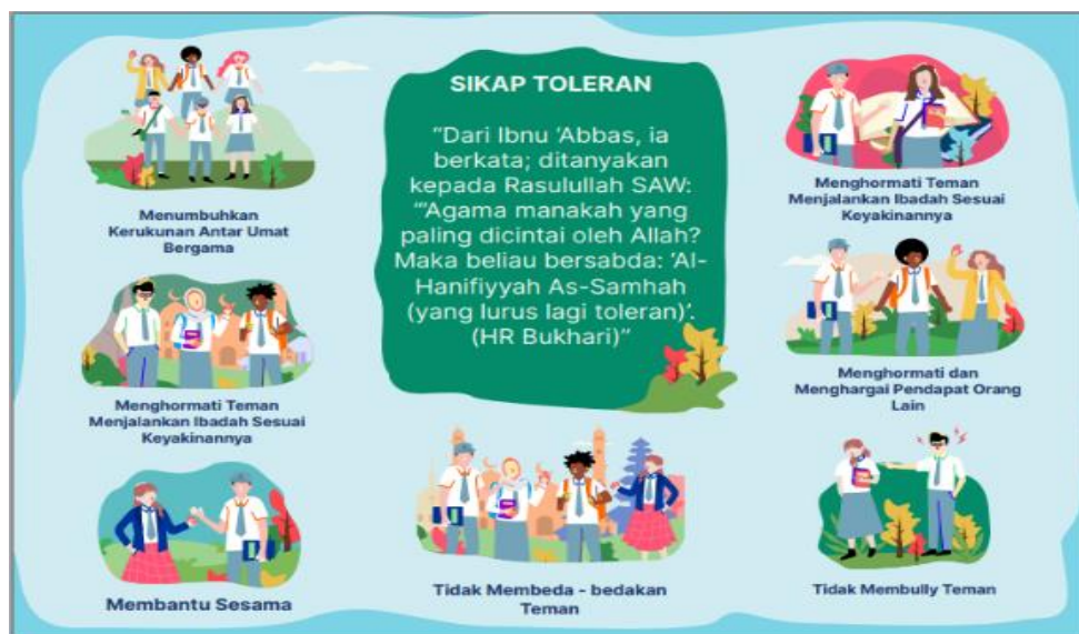
Gambar 11. Revisi Tahap 1 Desain Perilaku Toleransi

ditambahkan Hadist Rosulullah SAW terkait dengan toleransi.