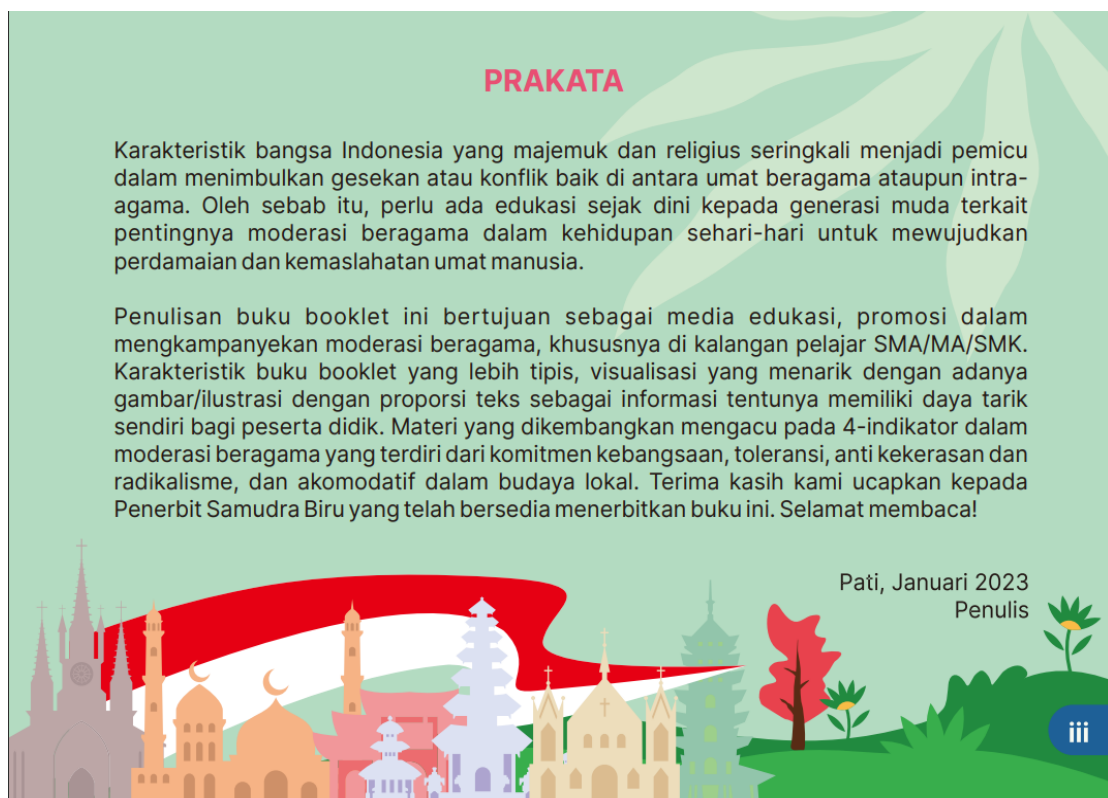
Gambar 7. Revisi Tahap I Desain Kata Pengantar