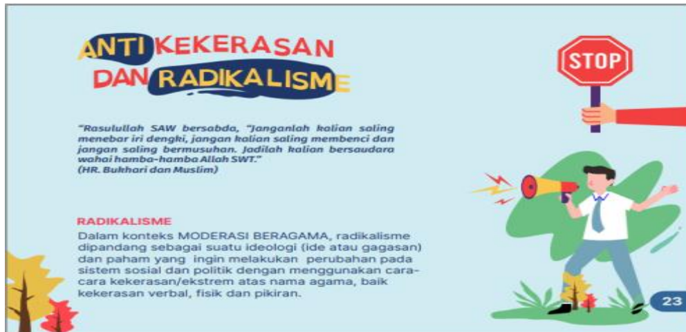
Gambar 14. Draf II Desain Anti Kekerasan & Radikalisme

Berikut adalah beberapa contoh revisi produk tahap II.