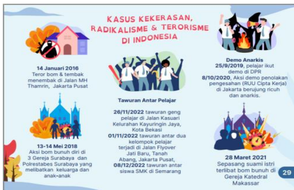
Gambar 17. Revisi Tahap II Desain Kasus Kekerasan &amp; Radikalisme

Berdasarkan hasil revisi tahap II, diperoleh Draf III yang kemudian dilakukan uji lapangan atau bisa disebut juga dengan uji kelompok besar. Uji ini dilakukan dilakukan untuk melihat efektifitas produk yang dikembangkan dalam meningkatkan pemahaman moderasi beragama siswa SMA/MA/SMK. Draf-III ini yang kemudian diujicobakan ke