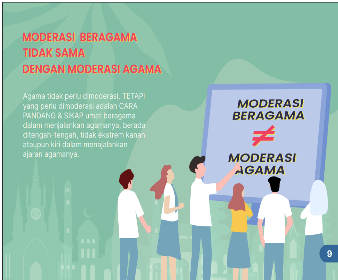
Gambar 8. Draf I Desain Moderasi Beragama