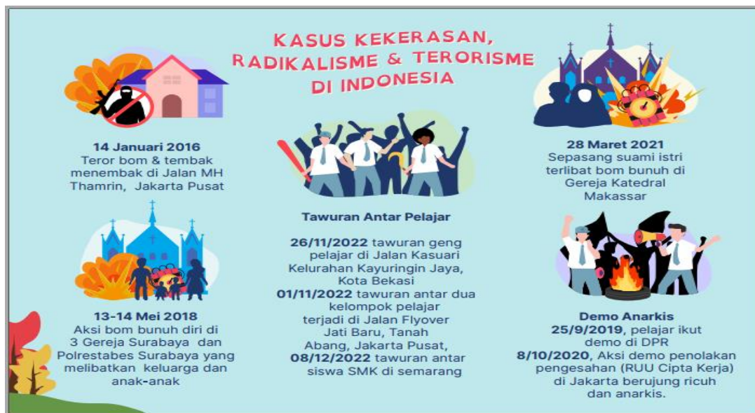
Gambar 13. Revisi Tahap 1 Kasus Kekerasan &amp; Radikalisme di Indonesia

Berdasarkan hasil revisi tahap I diperoleh Draf II yang selanjutnya dari daraf II dilakukan uji keterbacaan siswa dilakukan dengan skala kecil. Uji ini diberikan kepada 9 orang peserta didik yang mewakili siswa