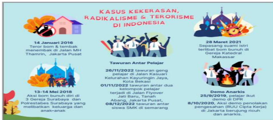
Gambar 16. Draf II Desain Kasus Kekerasan &amp; Radikalisme