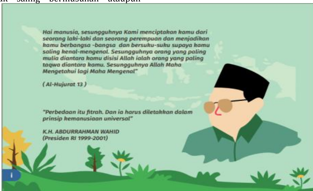
Gambar 5. Revisi Tahap I Desain Kutipan Tokoh Nasionalisme

perpecahan, namun untuk saling mengenal satu sama lain. Hal ini sudah tercantum dalam Al Qur'an dalam surat Al-Hujarat:13. Selain itu juga ditambahkan kutipan tokoh nasionalis tetapi juga dari ulama Islam yaitu K.H Abdurrahman Wahid.