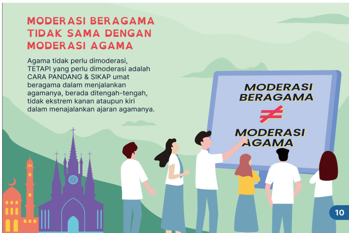
Gambar 9. Revisi Tahap I Desain Moderasi Beragama