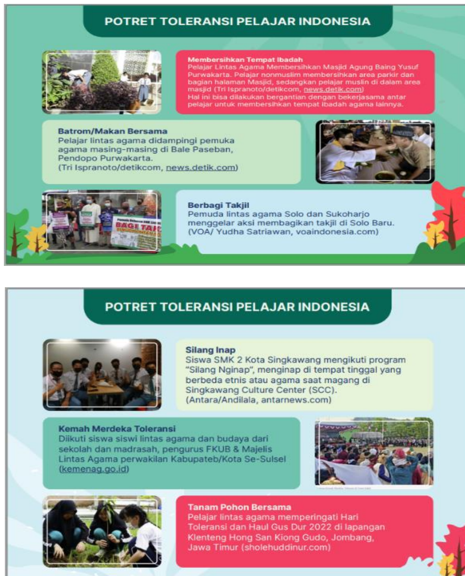
Gambar 12. Revisi Tahap 1 Potret Perilaku Toleransi di Kalangan Pelajar