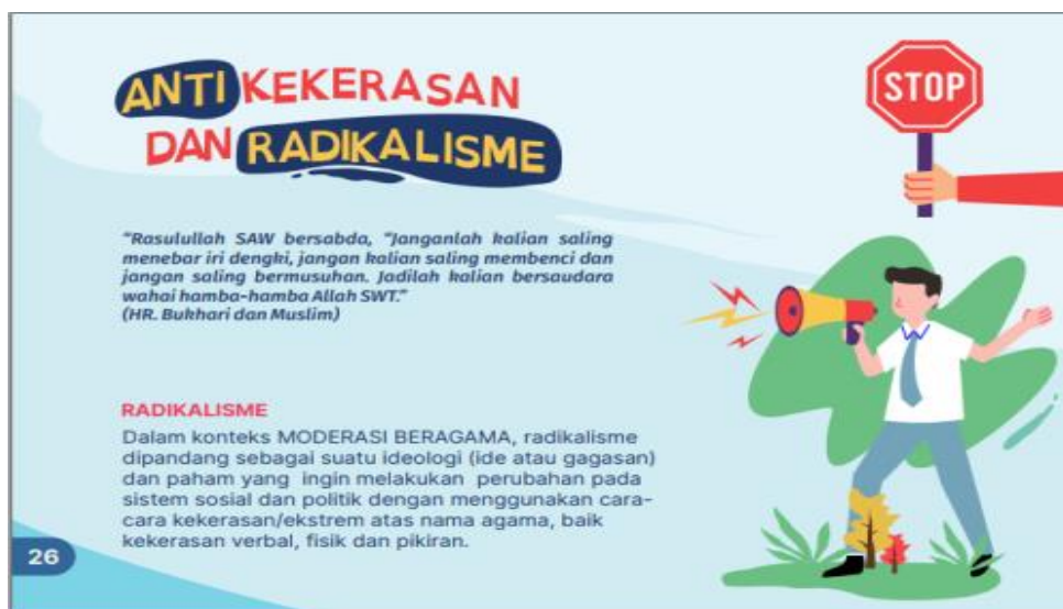
Gambar 15. Revisi Tahap II Desain Anti Kekerasan & Radikalisme