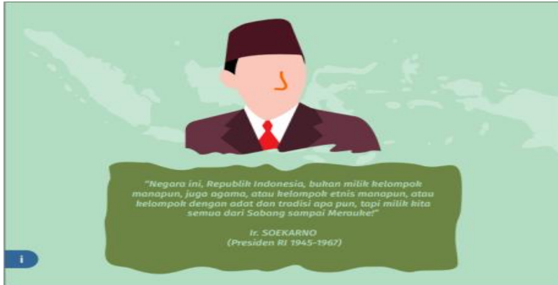
Gambar 4. Draf I Desain Kutipan Tokoh Nasionalisme

Pada halaman depan, desain awal sebagai pembuka yang diawali dengan kata-kata dari Bung Karno, namun pada revisi produk diganti dengan mengedepankan aspek bahwa manusia sejak lahir sudah berbeda. Perbedaan ini bukan dijadikan bahan untuk saling bermusuhan ataupun