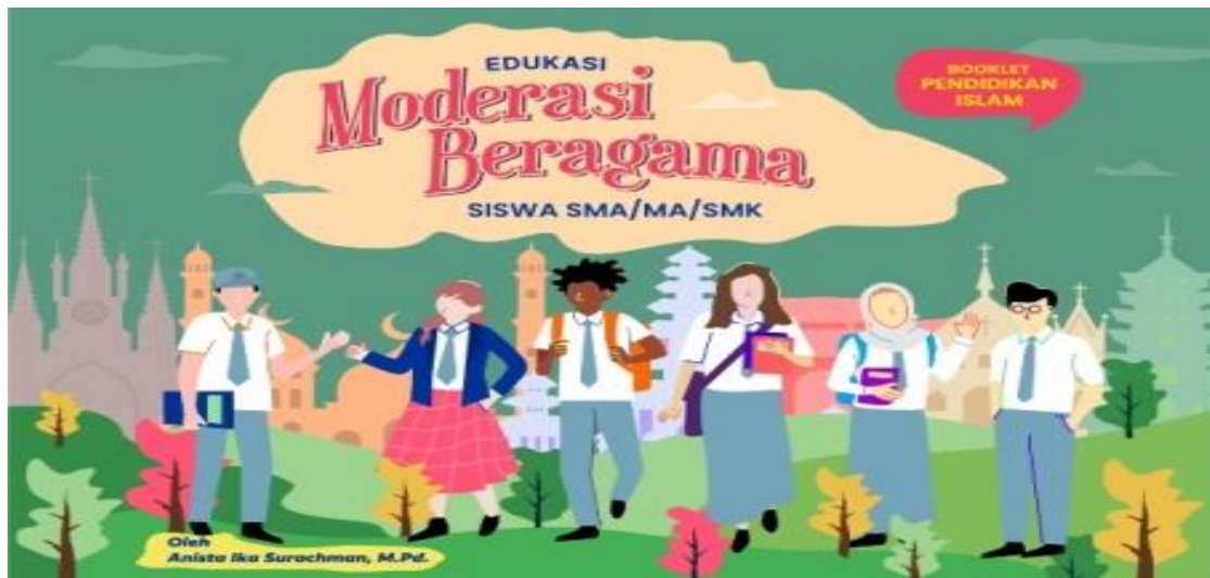
Gambar 3. Revisi Tahap I Desain Cover