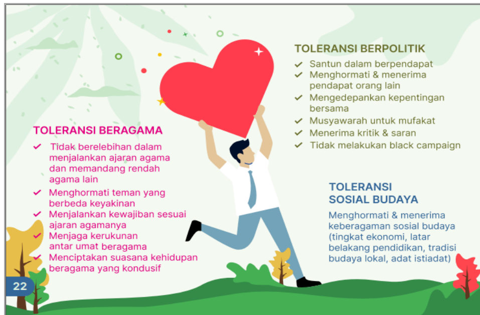
Gambar 10. Draf I Desain Contoh Perilaku Toleransi

Penambahan contoh gambar/ilustrasi implementasi toleransi dalam kehidupan sehari-hari yang dilakukan oleh peserta didik. Selain itu juga