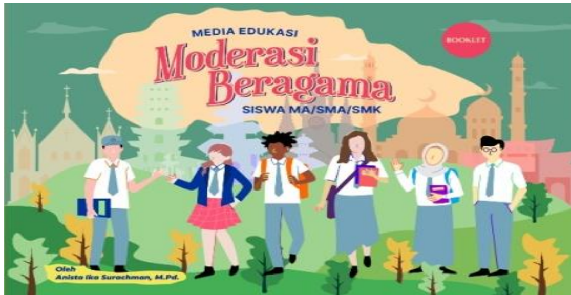
Gambar 2. Draf I Desain Cover