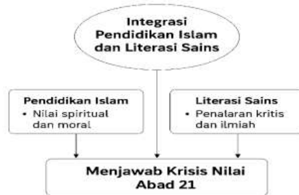
Gambar 1. Diagram Integrasi Pendidikan Islam dan Literasi Sains dalam Menjawab Krisis Nilai Abad 21

berinteraksi dengan lingkungan. Pendekatan ini selaras dengan model integratif kauniyah–qauliyah yang mendorong siswa menghubungkan fenomena ilmiah dengan nilai keislaman (tauhid, amanah, rahmah), sekaligus memperkuat kompetensi saintifik mereka (Rahmi, 2025).