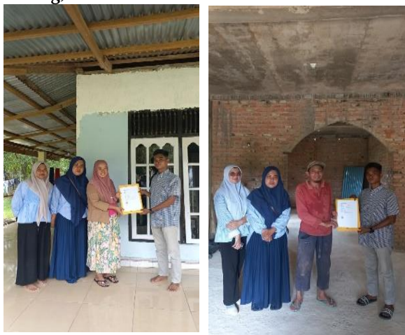
Gambar 3 : Serah Terima STTD Sertifikasi Halal oleh perwakilan Aparat Desa beserta Mahasiswa KKN