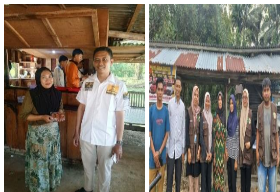
Gambar 2 : Pelaksanaan Survei Lapangan Sertifikasi Halal oleh pihak LPPH beserta Mahasiswa KKN

Belit Selatan yang diperlihatkan pada Gambar 2.