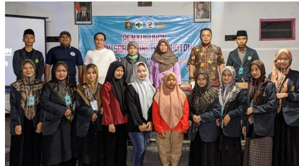
Gambar 1: Kegiatan Penyuluhan Dan Screening Kesehatan Reproduksi Remaja

mempromosikan kesejahteraan individu. Ada beberapa aspek penting dalam penyuluhan alat reproduksi yaitu pendidikan dasar tentang anatomi dan fungsi