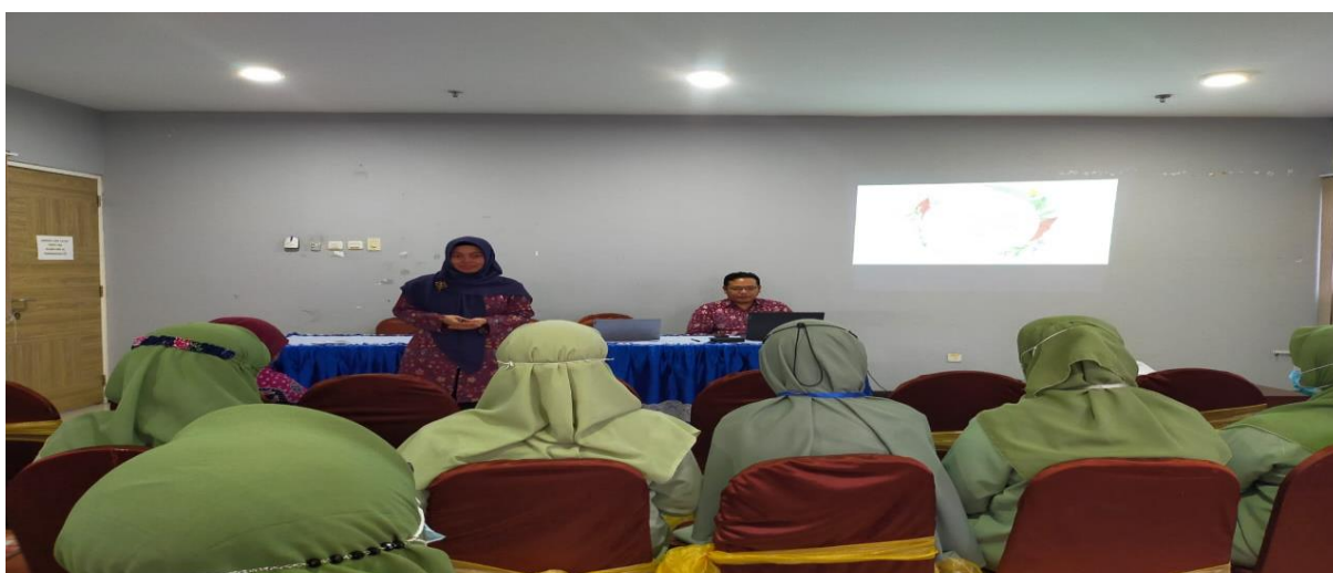
Gambar 3. Penyampaian Materi Terkait Ketentuan Bahan Halal RSI Aisiyah

Bahan yang berasal dari mikroba dan bahan yang dihasilkan melalui proses kimiawi, biologis atau rekayasa genetika diharamkan jika proses pertumbuhan atau pembuatannya tercampur, terkandung dan atau terkontaminasi dengan bahan yang diharamkan.