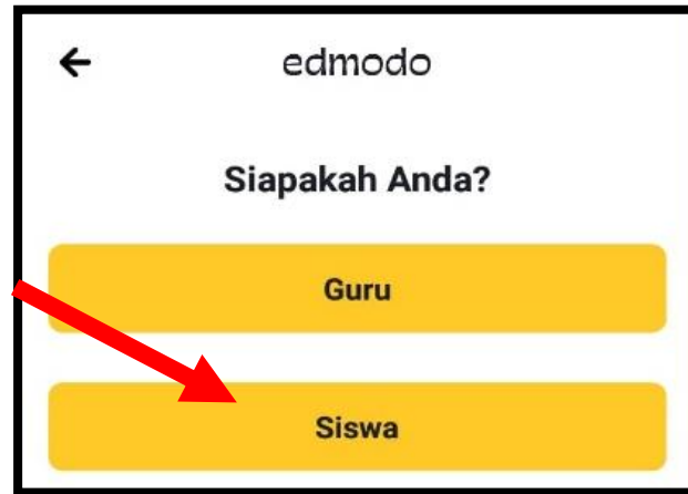
Gambar 2. Tampilan Akun Peserta didik