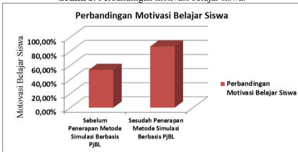
Grafik 1: Perbandingan motivasi belajar siswa.

Dari grafik di atas dapat diketahui bahwa hasil persentase rata-rata skor motivasi belajar siswa sebelum pembelajaran menggunakan metode simulasi berbasis project based learning adalah 53,53% dengan kategori rendah. Sedangkan persentase rata-rata skor motivasi belajar siswa setelah pembelajaran menggunakan metode simulasi berbasis project based learning adalah 86,71 % dalam kategori motivasi “sangat tinggi”. Peningkatan motivasi belajar siswa disebabkan mereka tertarik untuk mengikuti pembelajaran melalui simulasi langsung dimana seluruh siswa terlibat secara aktif dan memiliki peran masing-masing selama kegiatan pembelajaran. Terjadinya peningkatan motivasi belajar sebenarnya mulai terlihat ketika guru menjelaskan kegiatan pembelajaran