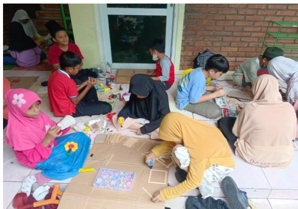
Gambar 5. Membuat Hasil Karya Siswa

Penanaman nilai spiritual lainnya yang diterapkan oleh SDIT Rahmaniyyah sesuai dengan gambar. 5 adalah peserta didik dilatih untuk kreatif dan mandiri. Penanaman nilai spiritual dengan mengembangkan kemampuan kreativitas ini tentunya dapat menggali kemampuan peserta didik untuk memiliki ide, mengembangkan daya pikir, dan mewujudkannya. Perilaku peserta didik ini selain melatih kemandirian juga mampu melatih kepercayaan diri yang menjadi hal penting peserta didik dalam menumbuhkan nilai-nilai spiritual. Kegiatan keterampilan ini dapat dilakukan melalui pembelajaran SBDP maupun mengikuti kompetisi perlombaan dalam keterampilan. Penanaman nilai spiritual berpengaruh terhadap prestasi belajar peserta didik. Hal ini sesuai dengan hasil penelitian Hasbi yang menjelaskan bahwa kecerdasan spiritual merupakan sebuah kecerdasan yang mampu berperan penting dalam individu untuk memecahkan masalah. Peserta didik yang memiliki spiritual yang tinggi mampu dan terarah dalam proses pengembangan perilaku. Peserta didik mampu mengontrol diri dan mampu membawa dirinya ke arah kehidupan yang lebih baik salah satunya dengan banyak menghasilkan prestasi-prestasi hasil belajar (Ashshidieqy, 2018).