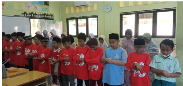
Gambar 2. Sholat Dhuha setiap pagi sebelum pembelajaran

Program ini tentunya masuk ke dalam penanaman nilai spiritual, dimana siswa mengikuti aturan yang ada dengan pembiasaan santun dan menghormati kepada guru maupun sebaliknya. Rina dalam hasil penelitiannya menyatakan bahwa hal-hal yang termasuk ke dalam spiritual antara lain : 1) Kejujuran yaitu perilaku jujur dengan integritas moral yang tinggi dalam berperilaku, 2) Keterbukaan, yaitu kemampuan untuk menerima ide-ide, pandangan, dan pengalaman baru, 3) Pengetahuan diri, yaitu memahami keyakinan diri terhadap nilai-nilai lebih mendalam, 4) Fokus pada kontribusi, yaitu orientasi seseorang memberikan dampak positif dalam kehidupan orang lain dan dunia di sekitar mereka, 5) Spiritualitas non-dogmatis, yaitu pengakuan keyakinan keragaman spiritual dan praktiknya (Rina, I., Hermanti, 2019).