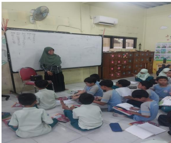
Gambar 6. KBM di dalam kelas

Penanaman nilai spiritual melalui pembelajaran di SDIT Rahmaniyyah dengan melakukan metode pembelajaran yang kooperatif, metode pembelajaran berbasis proyek atau masalah. Hal ini dapat dilihat dari hasil wawancara dengan Ibu Sukma yang menjelaskan bahwa dalam menerapkan nilai spiritual di lingkungan SDIT tentunya akan lebih mudah karena sekolah sudah mengintegrasikan nilai-nilai spiritual dalam kurikulum pembelajaran di sekolah. Namun hal yang sulit adalah bagaimana guru memilih metode yang tepat dalam menanamkan nilai spiritual melalui pembelajaran. Hal ini tentunya guru harus memiliki peran penting untuk dapat menggunakan metode yang tepat kepada peserta didik. Metode kooperatif dan pemecahan masalah terbukti berhasil menanamkan nilai spiritual kepada peserta didik melalui pembelajaran. Hal ini dapat dilihat dari perilaku peserta didik saat bekerjasama menyelesaikan masalah, berdiskusi. Peserta didik menjadi mandiri, disiplin, karakter keimanannya semakin terlihat saat memecahkan masalah dengan perilaku jujur dan selalu menyebut asma Allah. Selain itu sikap hormat sesama teman, guru muncul dalam proses pembelajaran.