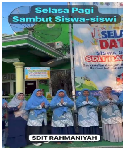
Gambar 1. Guru Menyambut Kehadiran Siswa Melakukan Senyum, Salam Sapa di Pagi Hari