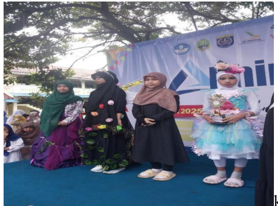
Gambar 7. Kegiatan siswa siswi SDIT Rahmaniayah dalam Fashion Show Islami

Strategi terakhir yang dilakukan SDIT Rahmaniayah dalam menanamkan nilai spiritual melalui kegiatan-kegiatan ekstrakurikuler berbasis nilai keislaman, seperti mengadakan perlombaan membaca/tilawah Al-Qur'an, menghafal surat dalam Al-Qur'an, serta fashion show busana muslim. Kegiatan-kegiatan tersebut menunjukkan bahwa meskipun berbasis Islam, SDIT Rahmaniayah juga tetap mengikuti perkembangan zaman dengan memunculkan kreativitas dan bakat yang dimiliki peserta didik namun tetap sesuai dengan syariat Islam. Hal ini didukung juga dengan hasil penelitian dari Saputri, bahwa perlombaan anak dapat menambah pengalaman dan bebas berekspresi dengan tetap mengedepankan nilai-nilai keislaman dan dapat memunculkan nilai spiritual yang tidak hanya di dapat diruang kelas namun melalui pembelajaran transformatif(Saputri et al., n.d.).