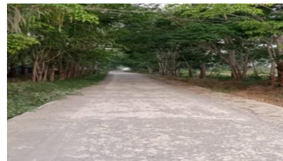
Sumber Dokumen Desa : Hasil Pembangunan Jalan

yang artinya untuk kedepannya terkait dengan pembangunan jalan harus dilaksanakan dengan lebih baik dari sebelumnya. Hasil penelitian menunjukkan bahwa adanya beberapa hasil dari proses pembangunan yang tidak sesuai dimana terlihat adanya hasil yang rusak meskipun baru beberapa bulan dibangun, hasil tidak sesuai dengan dana yang ada dan hasil tidak terlalu bagus. Pembangunan yang dilakukan juga banyak bermanfaat bagi masyarakat desa. Jadi dapat disimpulkan bahwa untuk indikator ulasan (review) pemerintah Desa Pengabuan masih belum menunjukkan hasil dari proses pembangunan yang maksimal.