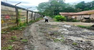
Sebelum Pembangunan Jalan

menyatakan padahasil kinerja yang telah dilaksanakan pemerintah desa telah sesuai dengan harapan yang masyarakat inginkan dimana setiap proses pembangunan yang dilakukan demi kepentingan masyarakat desa dan juga memberikan manfaat bagi masyarakat walaupun hasil dari pembangunan jalan sendiri belum maksimal dan dapat dikatakan tidak terlalu baik.