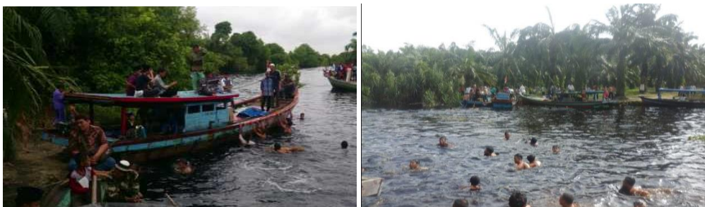
Gambar3. Suasana Diluar Makam

Sementara masyarakat yang tidak bisa memasuki makam, dikarenakan sudah penuh Maka mereka membuat aktivitas sendiri seperti halnya mandi ditepi sungai, mengambil air wudhu' mengambil ranting pohon di tepi sungai. Seperti gambar yang tertera dibawah ini :