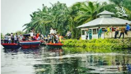
Gambar 4. Foto makam