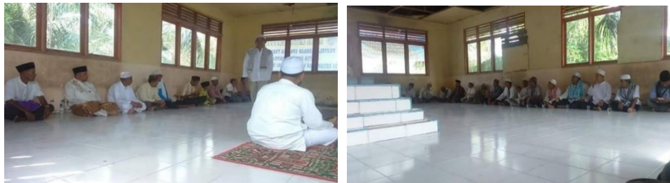
Gambar 2. Suasana Berada Didalam Makam

Hanya pemangku Adat, khalifah, ulama-ulama, orang yang dituakan yang memasuki makam dan duduk bersila diatas tikar maupun diatas kramik menghadapi makam, membuat lingkaran bulat dan ditengahnya terdapat makam Tengku Abdul Pasai. Kemudian MC memulai Acara untuk memberi kesempatan untuk menyampaikan sambutan dengan urutan Camat, Khalifah, dan ditutup dengan pemangku adat. Pakaian yang dipergunakan saat pelaksanaan bersifat sopan dan bernuansa islami, seperti baju koko, baju muslim, baju batik, peci, dll. Pakaian jubah lengkap dengan sorban dan sarung, biasanya digunakan oleh pemangku adat, khalifah, ulama-ulama. Kondisi berlangsungnya ritual tersebut yang memberi kata sambutan, menceritakan sejarah dari Ritual Atib Ko Ambai , membaca Do'a, dan lantunan Azan sebelum mengemakan Zikir didalam perahu.