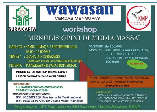
Gambar2. Contoh Kegiatan Kerjasama yang dilakukan KMP