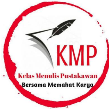
Gambar1. Lambang KMP.

Kelas Menulis Pustakawan merupakan komunitas yang didirikan dengan tujuan untuk berbagi melalui tulisan. Dengan demikian yang bergabung menjadi anggotanya adalah mereka (pustakawan atau yang tertarik dengan dunia kepastakawanan) yang mempunyai minat untuk menulis. Menurut Nurhadi (2004) menulis adalah suatu proses penuangan ide dalam bentuk simbol-simbol bahasa.(Pujiono, 2012)