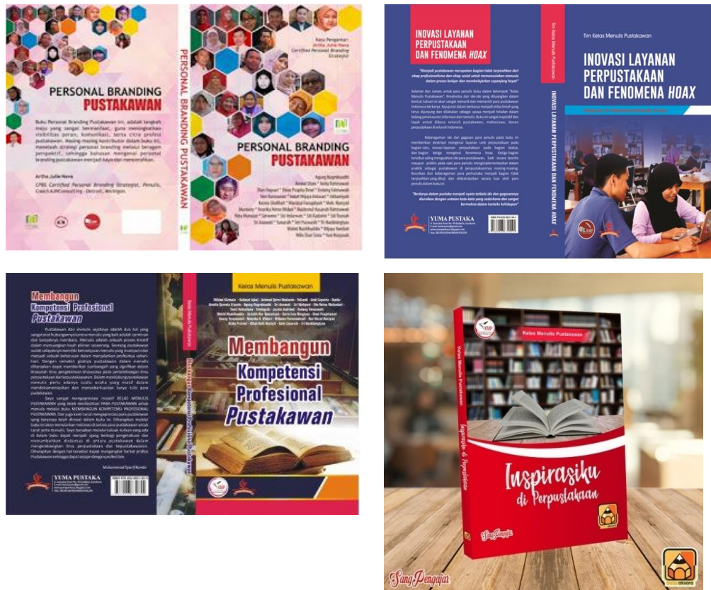
Gambar3. Enam (6) Buku Karya Anggota KMP

Sehubungan dengan syarat harus berkontribusi dalam Antologi KMP tersebut, peneliti telah ikut berkontribusi dalam 3 buku antologi yaitu Pustakawan dan Pemaknaan Buku, Personal Branding Pustakawan, dan Layanan Perpustakaan.