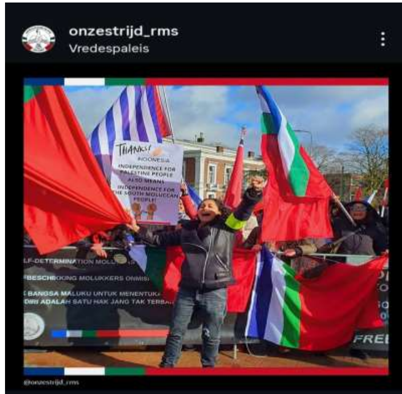
Gambar 5. Narasi Kemerdekaan dan Solidaritas Politik dalam Konten Instagram RMS