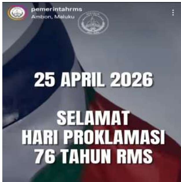
Gambar 2. Peringatan 76 Tahun Republik Maluku Selatan

Unggahan yang memuat pesan "Selamat merajakan 76 tahun Republik Maluku Selatan" menunjukkan upaya RMS dalam mereproduksi memori sejarah melalui media sosial. Secara denotatif, unggahan tersebut berisi peringatan hari jadi ke-76 RMS yang dipublikasikan kepada pengikut akun Instagram. Pada tingkat konotasi, peringatan tersebut merepresentasikan upaya mempertahankan keberlanjutan identitas politik RMS melalui penguatan narasi sejarah. Menurut Barthes, tanda tidak hanya menyampaikan makna literal, tetapi juga dapat membangun makna ideologis yang diterima oleh kelompok sosial tertentu.