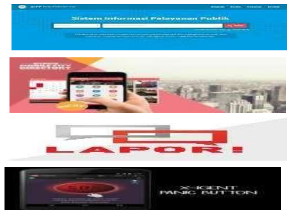
Gambar 1. Aplilasi Smart City

Dengan mengikuti perkembangan zaman, untuk melayani publik, pemerintah tidak hanya menyediakan pelayanan sistem konvensional, melainkan juga menyediakan pelayanan berbasis teknologi atau elektronik. Oleh karena itu, diharapkan pelayanan yang digunakan pemerintah dapat menggabungkan pekerjaan pegawai dengan sistem layanan berbasis teknologi atau elektronik seperti menyediakan sistem aplikasi yang dapat memberikan informasi kepada masyarakat dengan mudah, cepat dan tepat. Sesuai pendapat Baur dan Wee dalam (Hendriyadi, 2019) menyatakan bahwa salah satu dalam mengimplementasikan revolusi industri 4.0 pada pegawai atau tenaga kerja (labor), adanya kolaborasi manusia dengan robot atau teknologi. Berikut ada beberapa aplikasi layanan publik berbasis online dalam mengatasi permasalahan yang ada di masalah. Seperti pada gambar-gambar dibawah ini: