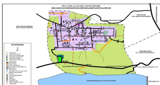
Gambar 2 Peta Lokasi Penelitian

Penelitian ini melibatkan berbagai aktor dari tingkat nasional hingga lokal, termasuk: