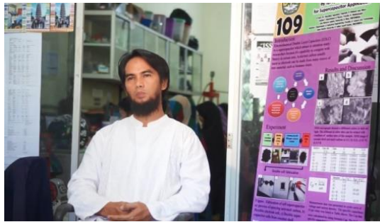
Gambar 6. Output Bener Dosen