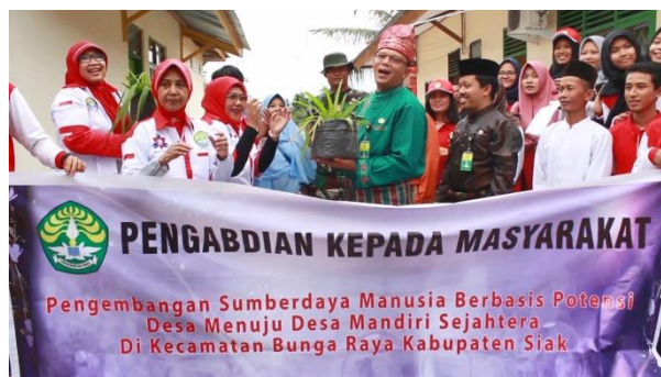
Gambar 10. Kegiatan Dosen Bersama Masyarakat