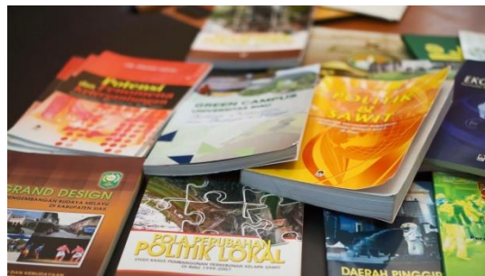
Gambar 7. Output Buku Dosen-Dosen