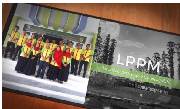
Gambar 12. Desain Buku Dalam Video Dengan Software After Effect