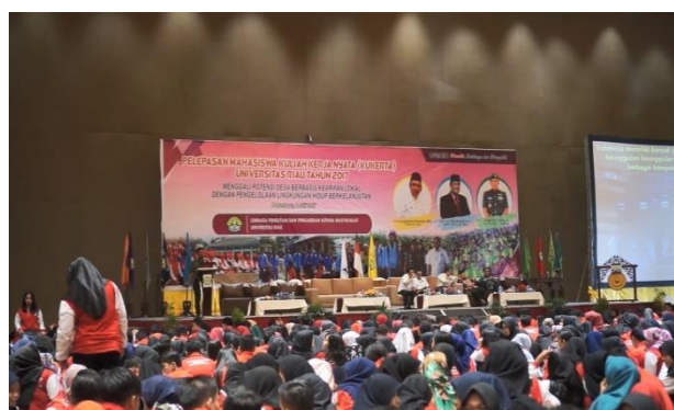
Gambar 11. Kegiatan Bersama Mahasiswa (Sumber : Hasil Audiovisual LPPM Universitas Riau)