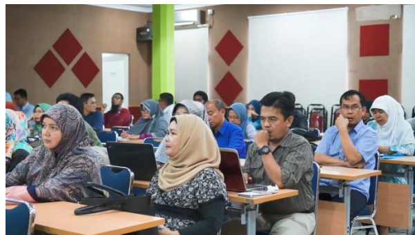
Gambar 9. LPPM Bersama Dosen-Dosen