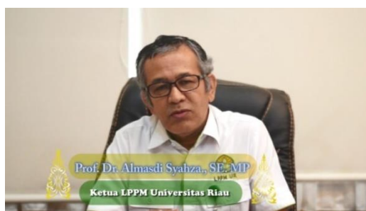
Gambar 4. Wawancara Dengan Ketua LPPM