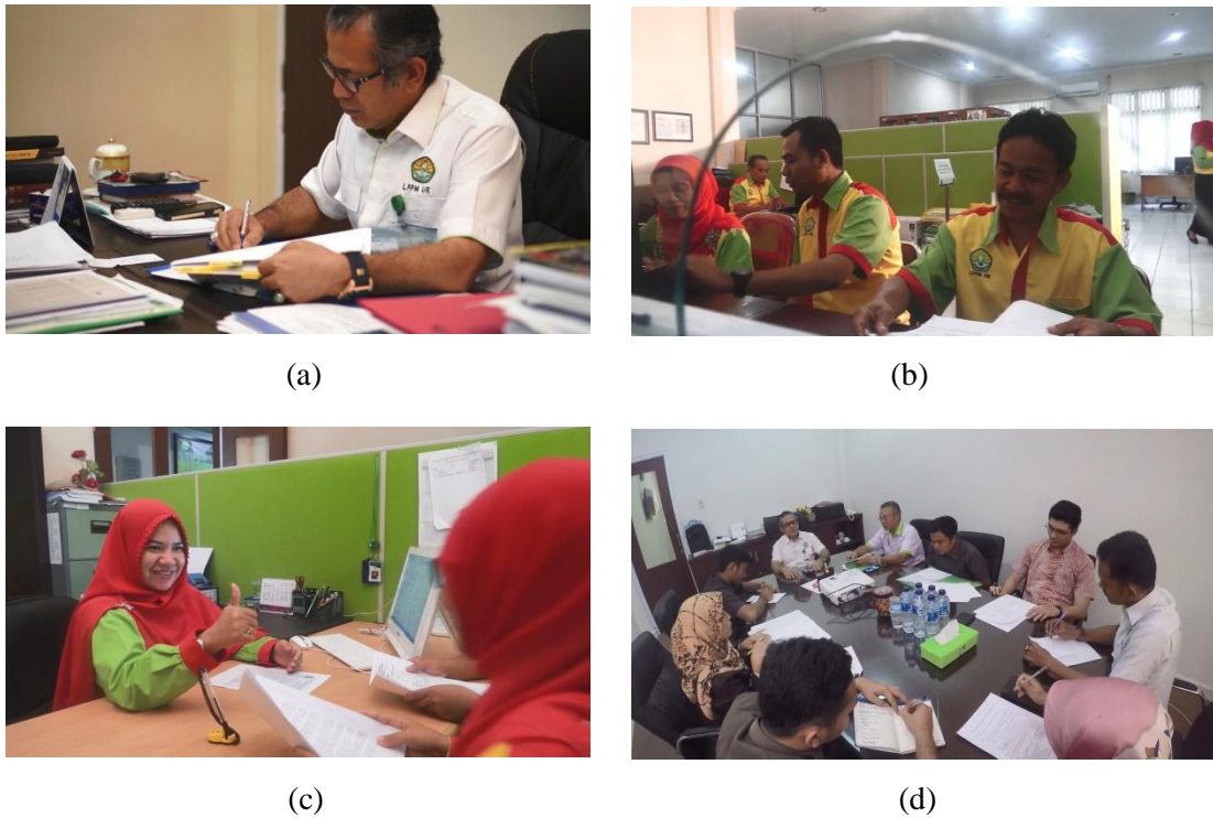
Gambar 8. Etos kerja yang ditampilkan dalam video (a)(b)(c)(d)

Kegiatan - kegiatan yang dilakukan oleh LPPM Universitas Riau, etos kerja tidak hanya ditampilkan dari pimpinan dan staff LPPM Universitas Riau juga dilihat dari kegiatan-kegiatan yang dilakukan oleh LPPM bagaimana keseriusan dosen-dosen untuk mengikuti kegiatan tersebut, mereka bersemangat untuk mendapatkan informasi yang disampaikan oleh LPPM Universitas Riau. Pesan-pesan yang disampaikan bagaimana lembaga yang mandiri dalam melaksanakan berbagai kegiatan penelitian dan pengabdian.